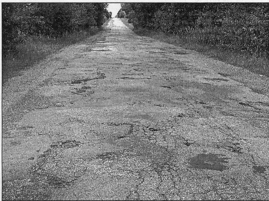
● Gandrīz sešu kilometru garumā uz jaunu asfalta segumu nākamgad var cerēt ceļa posms no Aizkalnes līdz Korsikovai.

Pirms rajona padomes sēdes pašvaldību vadītājiem bija dota iespēja izteikt savus priekšlikumus un programmas ceļu sarak-