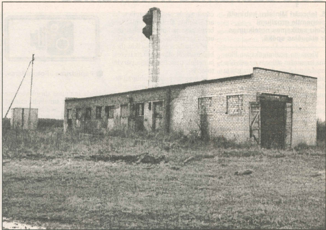
● Šī necilā ēka Ludzas rajona Brīgu pagastā kļuvis par 41 SIA juridisko adresi.