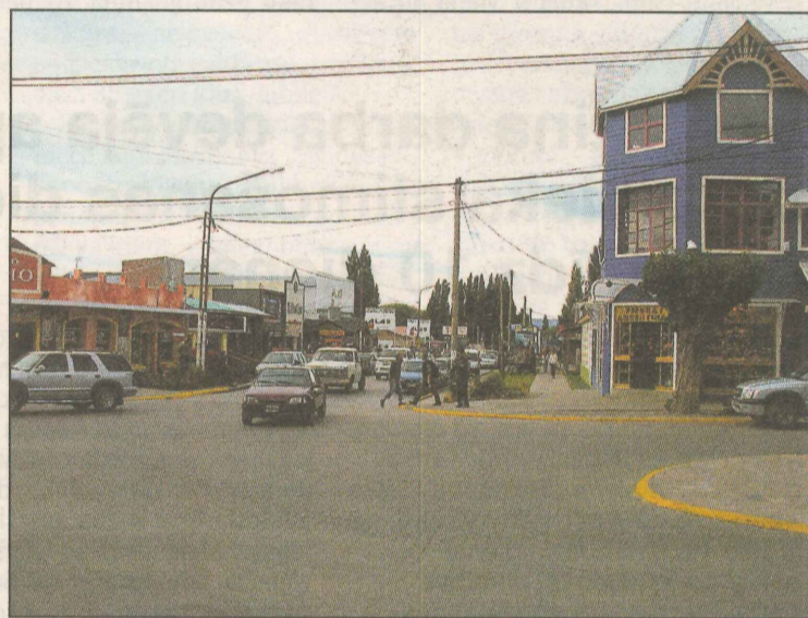
● El Kalafates pilsētas centrālais krustojums. Pilsēta orientēta uz tūrisma un tūrisma pakalpojumu sniegšanu. Tik daudz bruģētu ielu Latvijā ir tikai Ventspilī. Tajā pašā laikā arī smilšu un putekļu netrūkst. Ko lai dara, jo vējainā laikā tos sanes no tuvākās apkārtnes.

Tagad varu atzīties, ka iespaidi par ledājiem ir visfantastiskākie — milzīgais Upsalas ledājs,