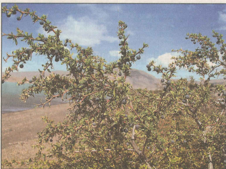
● Kalafates ogu krūms Lago Argentino jeb Argentīnas ezera krastā. No šiem asajiem zilo ogu krūmiem pilsēta ieguvusi arī savu nosaukumu. Krūmi izmēru ziņā ir dažādi — lielākie varētu būt kārtīga jasmīnu krūma lielumā, mazākie kā zīleņu krūmi. Vizuāli un pēc izmēra ogas ļoti līdzīgas zīlenēm. Pēc garšas rūgtenas kā pilādzim, sausas kā korintes un ar nelielu kauliņu vidū. Vietējie iedzīvotāji no tām gatavo ievārijumu, kaltē un vāra arī tēju.

Vedjmas ledājs, mūsu apceļotais Perito Moreno ledājs, kura mēle burtiski iegāzas Argentīnas ezerā. Visinteresantāk ir ap pusdienlaiku, kad atskan brikšķi un ledus gabali pa vienam vien iešļūk ezera ūdeņos. Redzējām