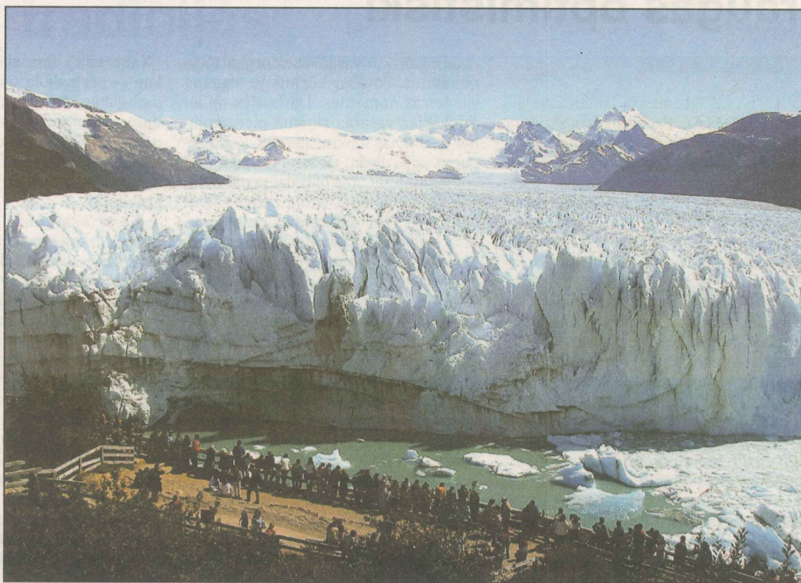
● Perito Moreno ledājs Argentīnā ir daļa no Los Glaceros nacionālā parka. Platforma ar stāvošajiem cilvēkiem atrodas aptuveni ledāja vidū. Pēc tā var apjaust ledāja patieso augstumu.