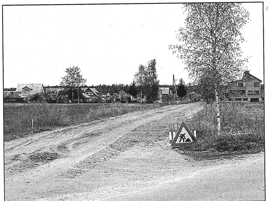
● Šonedēļ Rožupes ielu klās jauns asfalta segums.