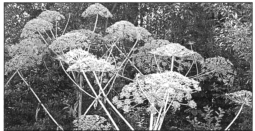
● Pie invazīvajiem augiem pieskaitāmi arī latvāņi, kas pašlaik Latvijas lauksaimniekiem sagādā ne mazums problēmu. Cerības uz veiksmīgu izmantošanu nepiepildījās, tagad jādomā, kā izskaust.

Valsts pārvaldes iestādēm pēc VAAD pieprasījuma ir jāsniedz viņu rīcībā esošo informāciju par Latvijas dabai ne-