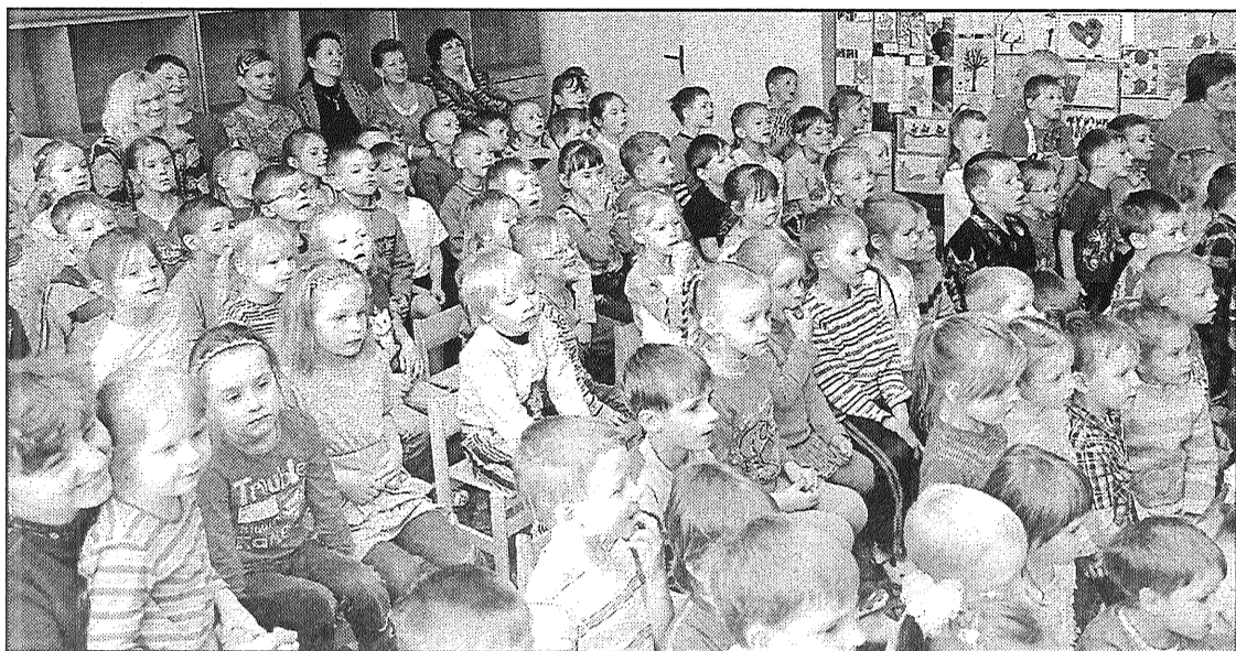
● Kā mums patik teātris!