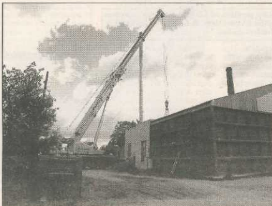
● Lai Liepu ielas katlumājā uzstādītu jaunus šķeldas katlus, ēkai nācās noņemt jumta pārsegumu. Pēc katlu novietošanas pārsegums ar ceļamkrānu tika atjaunots.

Turpinās apkures iekārtu pieslēgšana. Darbu noslēgumā jaunie katli tiek pārbaudīti un drīzumā tos iedarbinās. Šos darbus veic ražotāju uzņēmums — akciju sabiedrība «Komforts». Siltumražošanas ierīču nomaiņas un ar to saistīto papilddarbu izmaksas sasniegs ap-