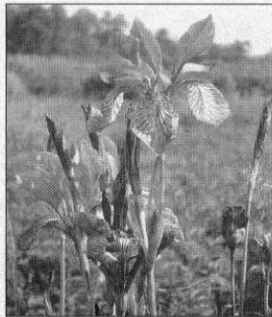
● Sibīrijas skalbe.

Simtu puķu kronīt' pinu Pašā Jāņu vakarā; Sanāk simtu tēva dēlu, Nevar ziedu izskaitīt. Atnāk mans mīļais Jānis, Pa vienam izskaitīja.