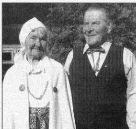
● Pēc kopā pavadīta pusgadsimta uz zelta kāzu sliekšņa.

No aktīvas darbošanās abi bijām iekrituši lauku klusumā, tagad atceras Veronika. Bet prieks pats no sevis nerodas, tam vāja