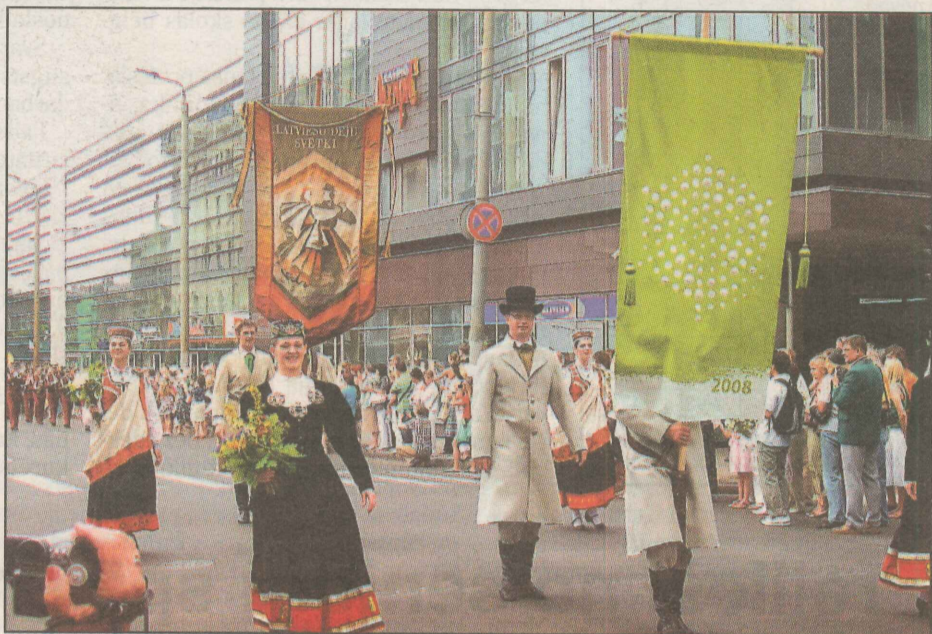
● 2008. gada Dziesmu un deju svētku karogi.