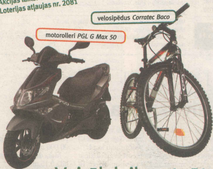
motorrolleri PGL G Max 50

Akcijas laiks: 02.06.08. – 31.08.08. Loterijas noteikumi: www.hipo.lv Loterijas atļaujas nr. 2081