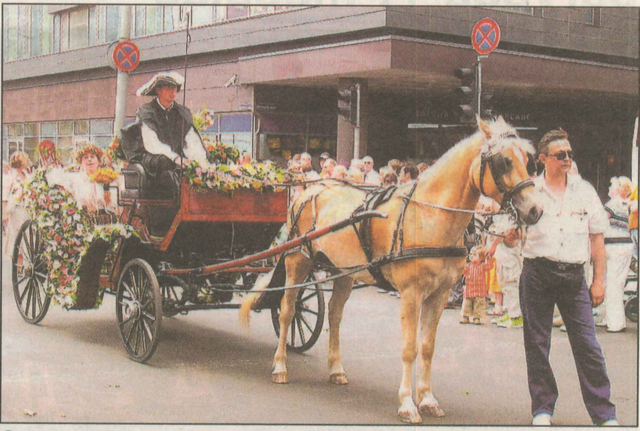
● Svētku gājienā kā pirmie devās Kurzemes novada kori un deju kolektīvi. Katrs rajons bija pacenties par īpašu muzikālo un vizuālo noformējumu, tāpēc starp meitenēm un puīšiem tautas tērpos bija redzami neparastāki skati, piemēram, bagātīgi rotāts pajūgs, vai... blūķi iekalts noziedznieks (teātra amatierkopas uzņācienā).