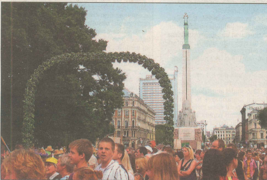
● Gājieni sākās 11. Novembra krastmalā. Tuvojoties Brīvības piemineklim, gājiena dalībniekiem bija jāiziet cauri Goda vārtiem.