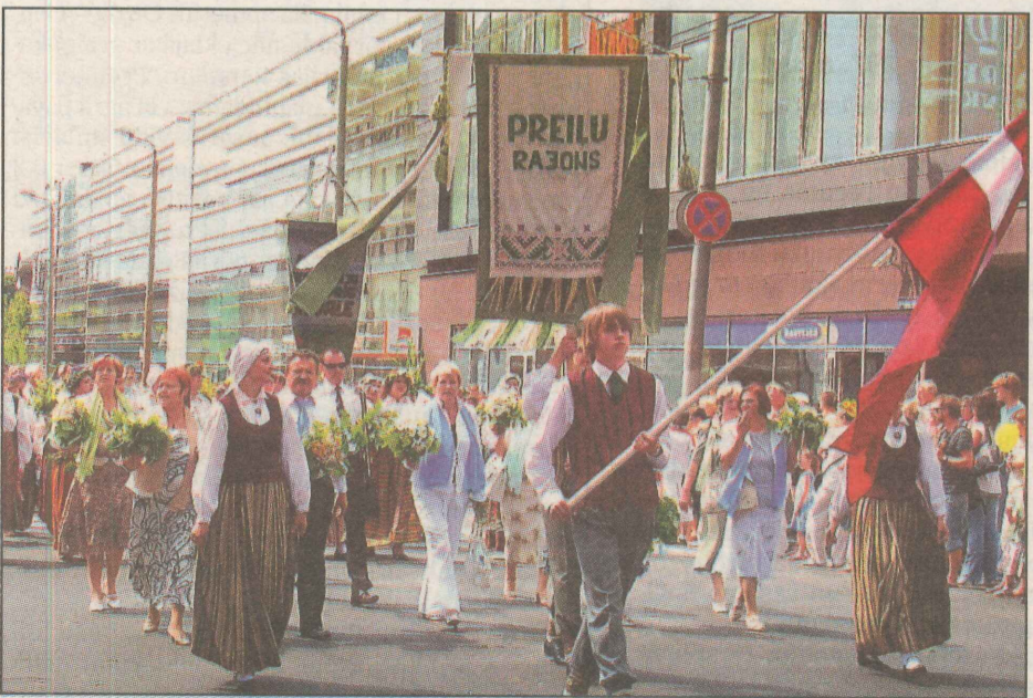
● Visu uzmanība — Latgales novada uzņācienam. Gājienā — Preiļu rajona kolektīvi, pašvaldību amatpersonas, kultūras darbinieki.