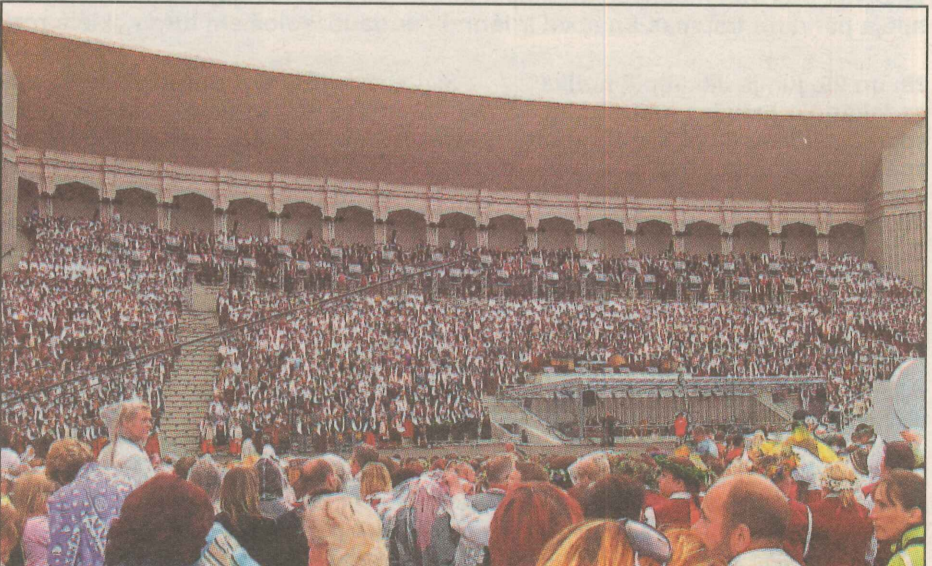
● Dziedāšanas un dejošanas svētki ir sākušies. Dziesmu svētku atklāšanas vērienīgo koncertu Mežaparka estrādē ar aplausiem sveica tūkstošiem skatītāju.