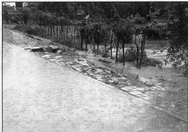
● 14. jūlijā spēcīgās lietus ūdens straumes izskaloja bruģēto ietvi Alūksnē, Miera ielā.

datiem, vētras nodarītie zaudējumi ir aptuveni 50 000 latu. 16. jūlija pēcpusdienā lielākā daļa nolauzto koku jau bija novākta. Daļēji veikts arī ēkām noplēsto jumtu remonts, citur jāizlīdzas ar pagaidu variantu, nostiepjot plēvi. «Lielāki darbi būs nepieciešami, lai atjaunotu Līvānu 1. vidusskolas ēkai daļēji noplēsto jumtu. Tā kā tā ir ārkārtas situācija, nekādus konkursus nerīkosim. Iespējams, jau piektdien varēs sākt remontu, jo nevar pieļaut, ka nokrišņi sabojā nesen izremontēto skolas aktu zāli, kas atrodas tieši apakšā noplēstajam jumtam,» teic domes izpilddirektors. Atjaunota satik-