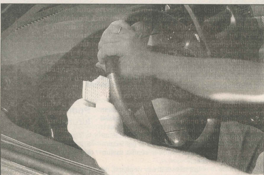
● Latgalīti uz Reigu brauc...

23,7% aptaujāto respondentu Latgalē ir nervozi, bet 60,7% braucot lamājas. Latvijā pie stūres dzied 24% autovadītāju — biežāk sievietes, gados jaunākie ap-