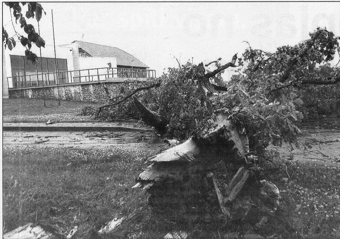
● Stihijas spēkam nespēja pretoties vecais ozols, kas auga pie Latgales mākslas un amatniecības centra Līvānos. Vējš to izgāza ar visām saknēm.