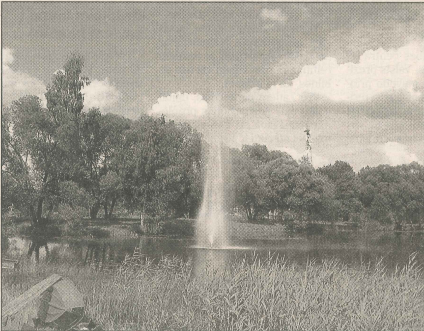
● Visā savā krāšņumā peldošās strūklakas darbība būs skatāma jau rīt vakarā, kad tā tiks svinīgi atklāta.