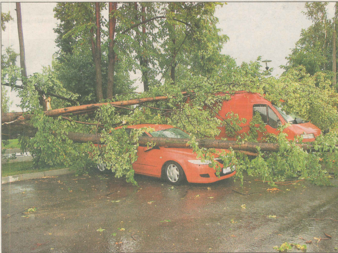
● Pagājušās pirmdienas viesuļvētra Līvānos plēsa jumtus un gāza kokus. Autostāvvietā pie Līvānu inženiertehnoloģiju un inovāciju centra, Domes ielā 3, kritoši koki uzgāzās vairākām automašīnām.

Aizvadītās pirmdienas, 14. jūlija, pēcpusdienā Līvānos, novada teritoriju un Jersikas pagastu skāra lietusgāzes, ko pavadīja spēcīgs vējš, sasniedzot vētras spēku. Nodarīti ievērojami postījumi. Vējš un vietām arī virpuļviesulis gāza kokus, noplēsa jumtus ēkām, tika traucēta elektrības padeve. Joprojām turpinās postījumu seku likvidēšana.