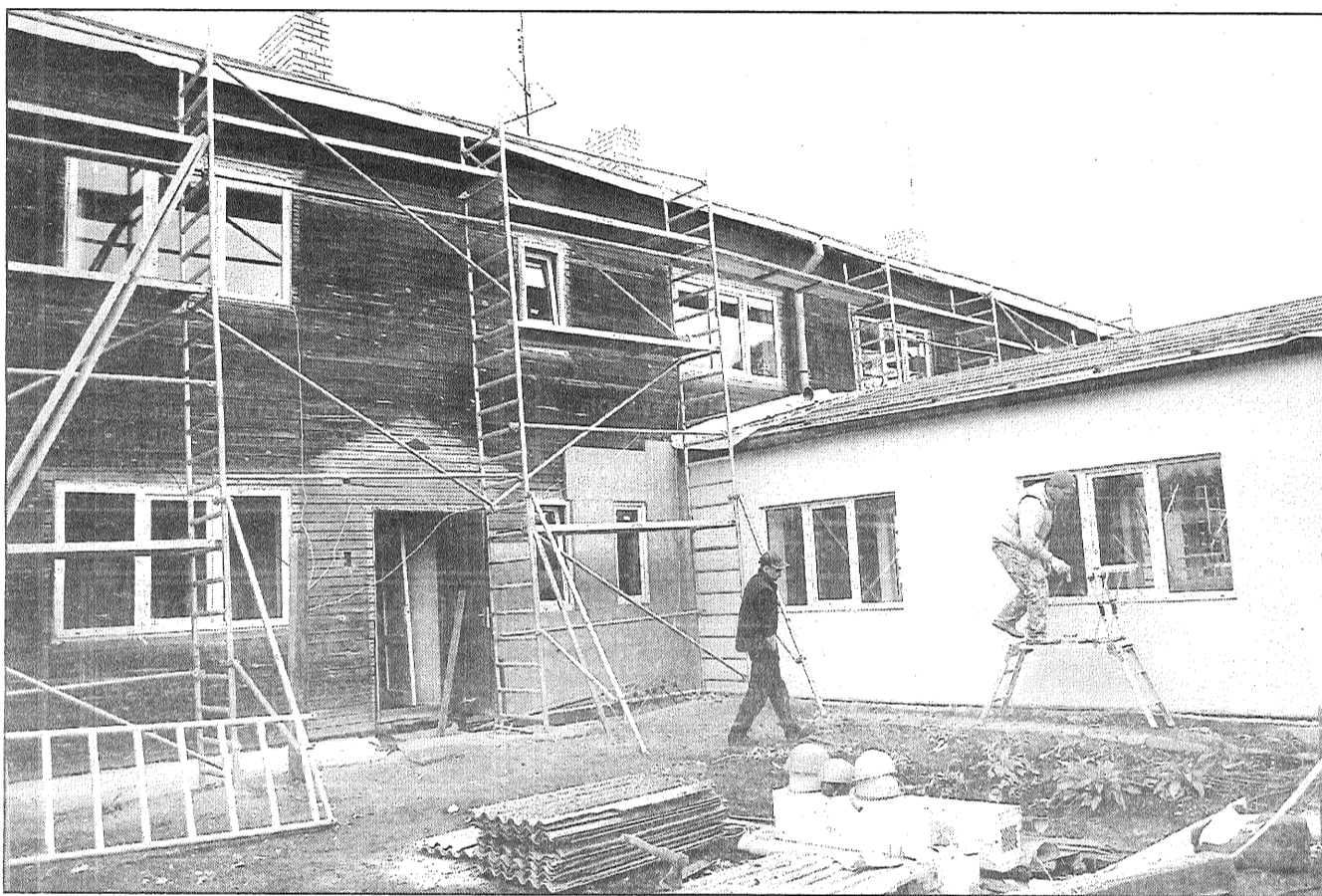
● Salenieku pansionātā turpinās vērienīgi renovācijas darbi gandrīz pusmiljona latu apmērā.

Salenieku pansionāta abu ēku korpusi apjoti ar sastatnēm, darbojas buldozers un cita tehnika, rosās celtnieki. No pansionāta iemītniekiem redzami tikai daži, kuri apmetušies uz soliņa pie ārdurvīm ieelpot rudenīgi svaigo gaisu. Citi uz apkārt notiekošo noraugās pa logiem. Soruden, un tāpat arī vasarā, pansionāta apkārtne no mierīgas noskaņas nebija ne vēsts. Iemītniekiem un personālam jāpaciesas, kamēr beigsies vērienīgie renovācijas darbi, un rāmais dienu ritējums