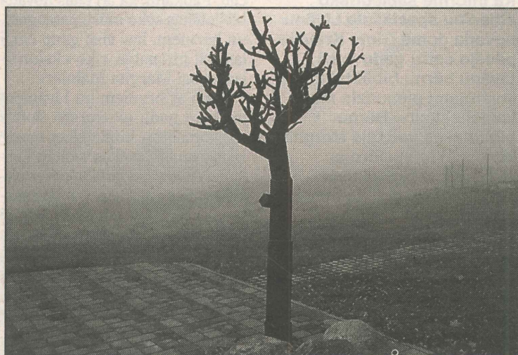
● Auglības koka zari atrodas samērā augstu no zemes, un tas jaunajiem pāriem un viņu vedējiem būs vēl viens pārbaudījums, ko ilgi atminēties — kā aizniegt koka zarus atslēgas iekarināšanai?