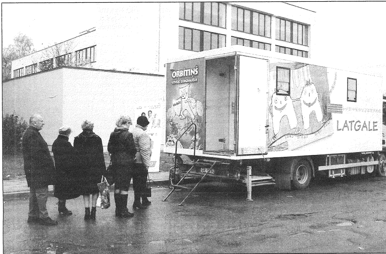
● Preiļiešu interese par mobilā zobārstniecības autobusa sniegtajiem pakalpojumiem bija tik liela, ka pie tā veidojās pacietīgo gaidītāju rinda.

Pagājušajā sestdienā, 11. oktobrī, daudziem preiļiešiem un tuvākās apkārtnes iedzīvotājiem bija iespēja apmeklēt mobilo zobārstniecības autobusu un saņemt speciālistu konsultācijas. Šāda iespēja saņemt bezmaksas pakalpojumus tika plaši izmantota, no pulksten 11.00 līdz 16.00 pie Preiļu galvenās bibliotēkas pulcējās dažāda gadagājuma cilvēki — pensionāri, pusaudži, māmiņas ar bērniem. Pie tam bērniem līdz 18 gadu vecumam konsultācijas tika sniegtas tikai vecāku klātbūtnē.