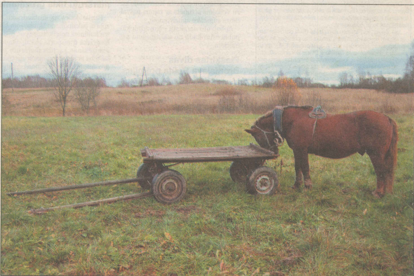
● Reģionālās attīstības un pašvaldību lietu ministrijā uzskata, ka piecu Preiļu rajona pašvaldību vēlme rajona iestādes pārņemt jau ar nākamā gada 1. janvāri ir pārsteidzīga. Zirgam tomēr jāiet ratiem pa priekšu.