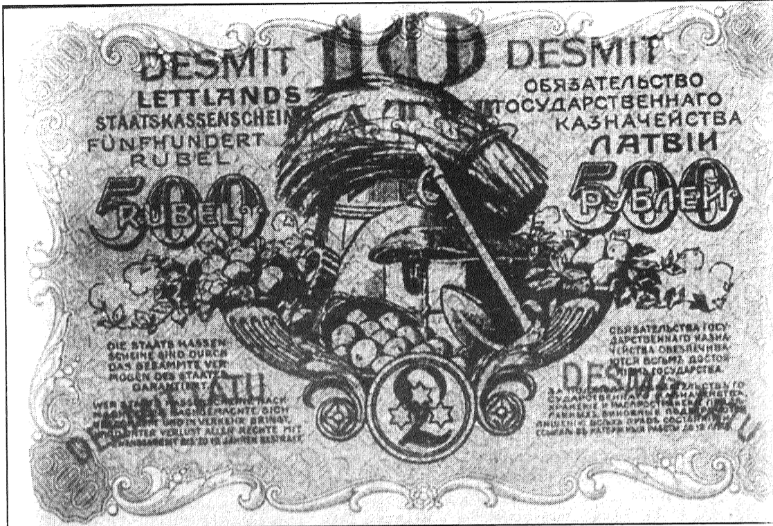
● Pirmie lati — Latvijas Bankas pagaidu naudas zīme, 1922. gada novembris.