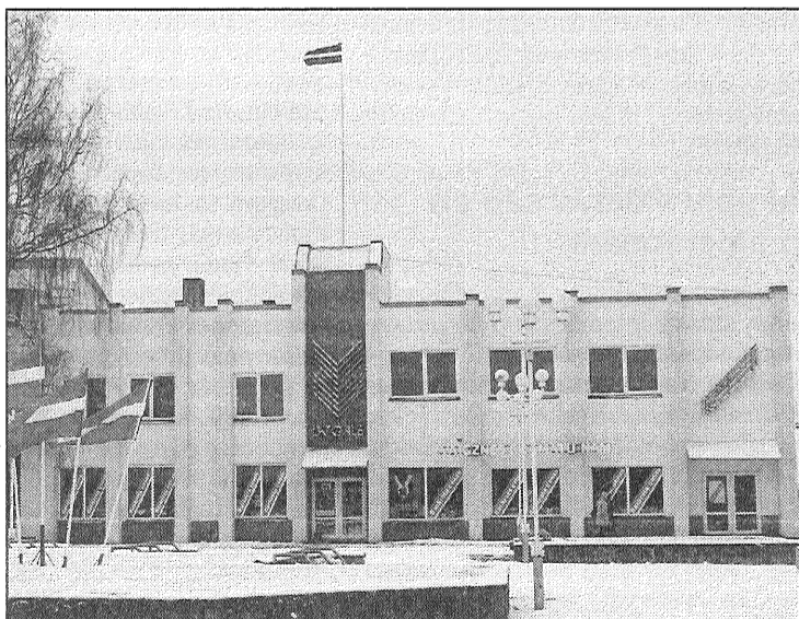
● Latvijas 90. dzimšanas dienas rītā Preiļos, virs grāmatu nama «Latgale» atkal uzvijās sarkanbaltsarkanais karogs, tāpat kā toreiz, pirms 19 gadiem. Daudziem, kas valsts svētku gaisotnē pacēla uz to skatienu, atmiņā nāca ne tik seni notikumi, kuros paši piedalījušies.

Šoreiz karogu mastā uzvilka SIA «Preiļu saimnieks» strādnieki.