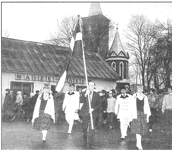
● 1989. gada 25. februārī pēc Latvijas karoga iesvētīšanas Preiļu Romas katoļu baznīcā.