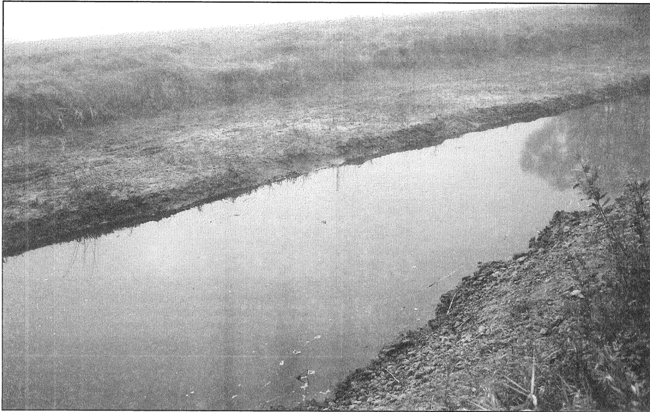
● Livānu novada upju padziļināšanas procesā Oša pārvērsta par divreiz šaurāku kanālu, bet otra daļa no upes gultnes ir izžuvusi un pamazām aizaug.