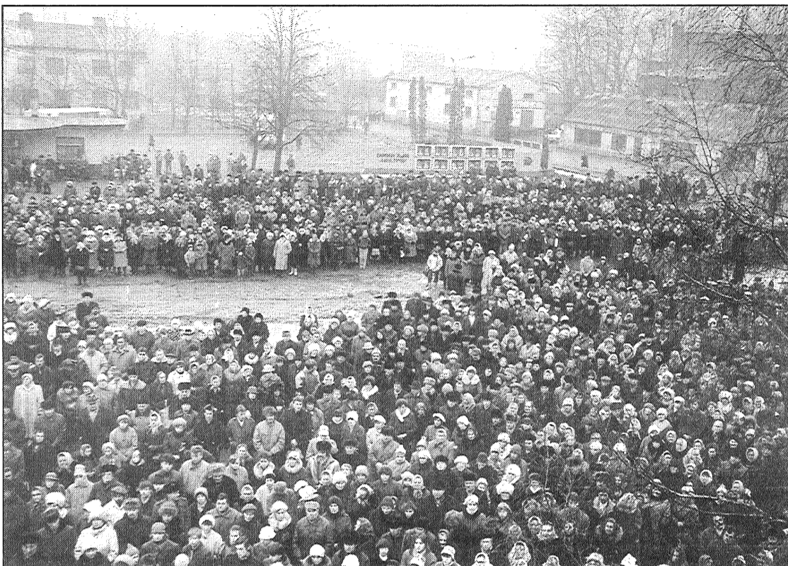
● Mītiņā par godu sarkanbaltsarkanā karoga uzvilksanai 1989. gada 25. februārī pie grāmatu nama «Latgale» Preiļos pulcējās tūkstošiem ļaužu.

Bet pirmie sarkanbaltsarkanie karogi rajonā tika sveikti vēl agrāk. 1988. gada 18. novembrī rīta agrumā karogs tika uzvilkt virs Aglonas internātskolas. Tajā pašā dienā ap pusdienlaiku mītiņā na-