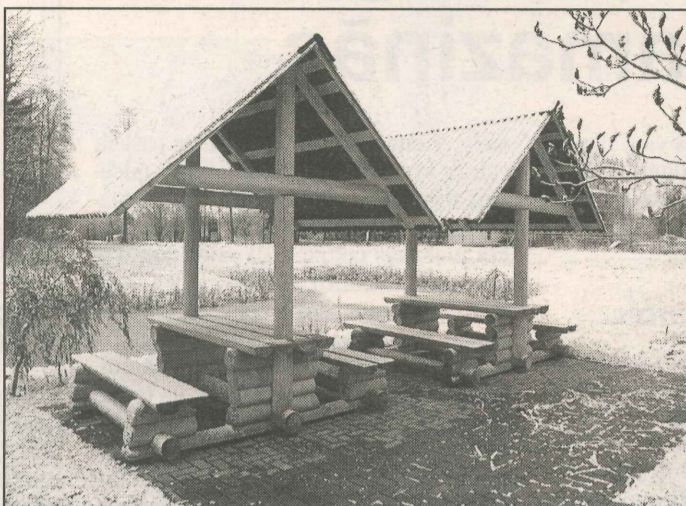
● Zaļā klase — mācībām āra apstākļos iekārtots stūrītis ar galdiem, nojumēm un apstādījumiem. Nodarbības Zaļajā klasē bērniem dod iespēju vairāk laika pavadīt svaigā gaisā, radošāku pieeju mācību procesam.

Laika gaitā pieņemts lēmums iesaistīties arī ekoskolas programmā, ko koordinē Vides aizsardzības fonds un kas pasaulē plaši izplatīta. Latvijā šajā projektā darbojas 65 skolas. Ekoskola ir nākotnes skola, kas māca skolēniem domāt un pieņemt lēmumus, vadoties no videi draudzīgiem principiem. Lai kļūtu par ekoskolu, jāievēro konkrēts darba ritms, kas sastāv no septiņiem ik gadus veicamiem soļiem un tēmām. Šie soļi ir: ekopadomes izveidošana, vides novērtējums, darbības plāns, pārraudzība un izvērtēšana, sasaiste ar mācību saturu, visas skolas un sabiedrības iesaistīšana, vides kodeksa izveide. Bet tēmas savukārt ir šādas: atkritumi, enerģija, ūdens, transports, veselīgs dzīvesveids, skolas vide un apkārtnē, mežs, klimata pārmaiņas. Jersikas pamatskolas ekopadomē darbojas 18 dalībnieki, skolēni, skolotāji, tehnisko darbinieku, vecāku un pašvaldības pārstāvji.