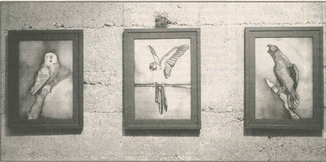
● Ieskats Latgales mākslas skolu audzēkņu noslēguma darbu izstādē. Skatītāju vērtējumam talantīgo jauno līvāniešu veikums.