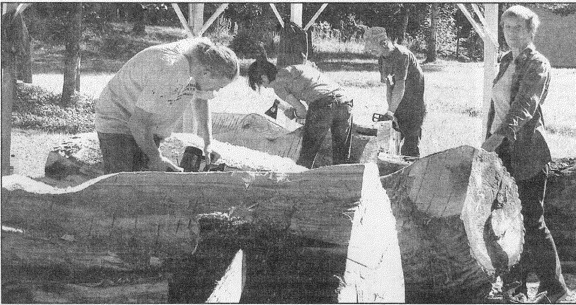
● Saules un rudenīgi silta vējiņa lutināti, koktēlnieki steidz strādāt. 10 dienu laikā dižkoku materiālam jāpārto skulptūrās. Prezentēšana paredzēta 30. oktobrī.

Preiļu muižas parkā šonedēļ top koka skulptūras un mākslas objekti, kas piesaista aizvien lielāku apmeklētāju uzmanību. Rodas jauni vaibsti vēsturiskajā vidē, kuru arī senāk, Borhu laikos, rotāja grieztas statuetes.