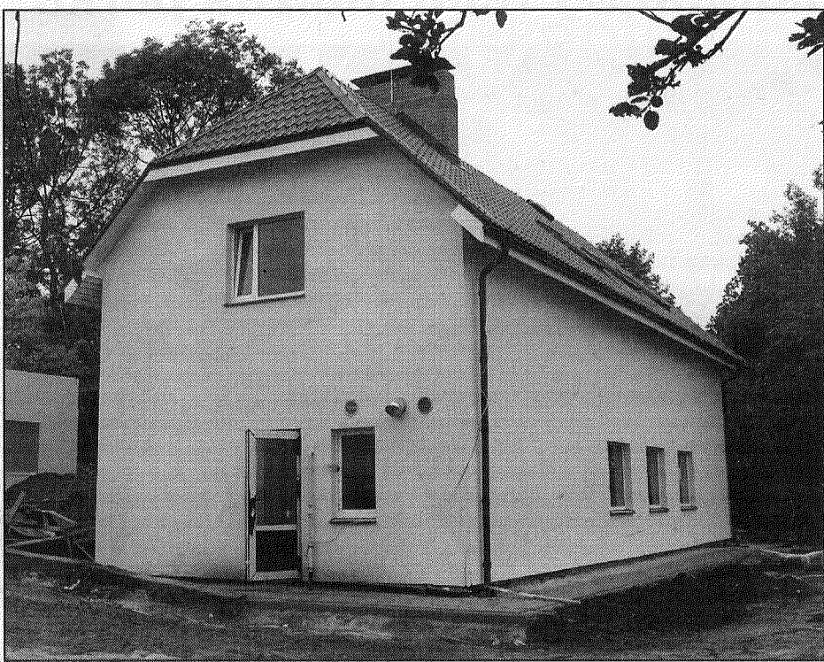
● Līvānu aktīvā tūrisma informācijas centra un velonomas ēku būvdarbi tuvojas nobeigumam.

Līdzās laivu stacijai tapusi vēl kāda neliela izmēra ēka, kas paredzēta velonomas ierīkošanai. Pilsētā tiek būvēti asfaltēti veloceliņi, tāds top arī līdz Jaunsilavām. Braukšana ar velosipēdiem ir draudzīga videi, nostiprina veselību, tā ir ekonomiska, tāpēc Līvānos liela uzmanība tiek pievērsta velotūrisma. Jau vairākus gadus pēc kārtas līvānieši iesaistās mobilitātes nedēļas pasākumos, kad atsakās no pārvietošanās ar automašīnām, bet izmanto velosipēdus. Aktīvā tūrisma svētkiem rosīgi gatavojas skolēni, kas apgūst velobraukšanu, lai iegūtu velosipēda vadītāja apliecības. Eksāmenu velo tiesību iegūšanai varēs nokārtot svētku ietvaros 18. septembrī. Tajā pašā dienā notiks kompleksais maratons komandām (divi kungi un divas dāmas, no kuriem — divi velosipēdisti, divi laivotāji) velokrosā un braucienā ar laivām pa Daugavu. Dienas gaitā iecerētas dažādas sporta aktivitātes: olu kari, vadības (kapteiņu) divciņa, badmintona piespēles, volejbola serves, tūrisma tehnikas stafete.