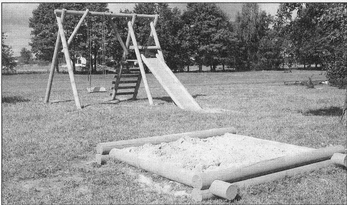
● Saunas pagastā par vienu labiekārtotu un atpūtai paredzētu vietu tagad vairāk. Par to vislielākais prieks jaunajai paaudzei un viņu vecākiem.

Preiļu novada Saunas pagastā Priekuļu pamatskolas apkārtnē aizvadītā vasarā piedzīvojusi labas pārmaiņas. Iekārtoti jauni dekoratīvie stādījumi, tapis rotaļu laukums bērniem.