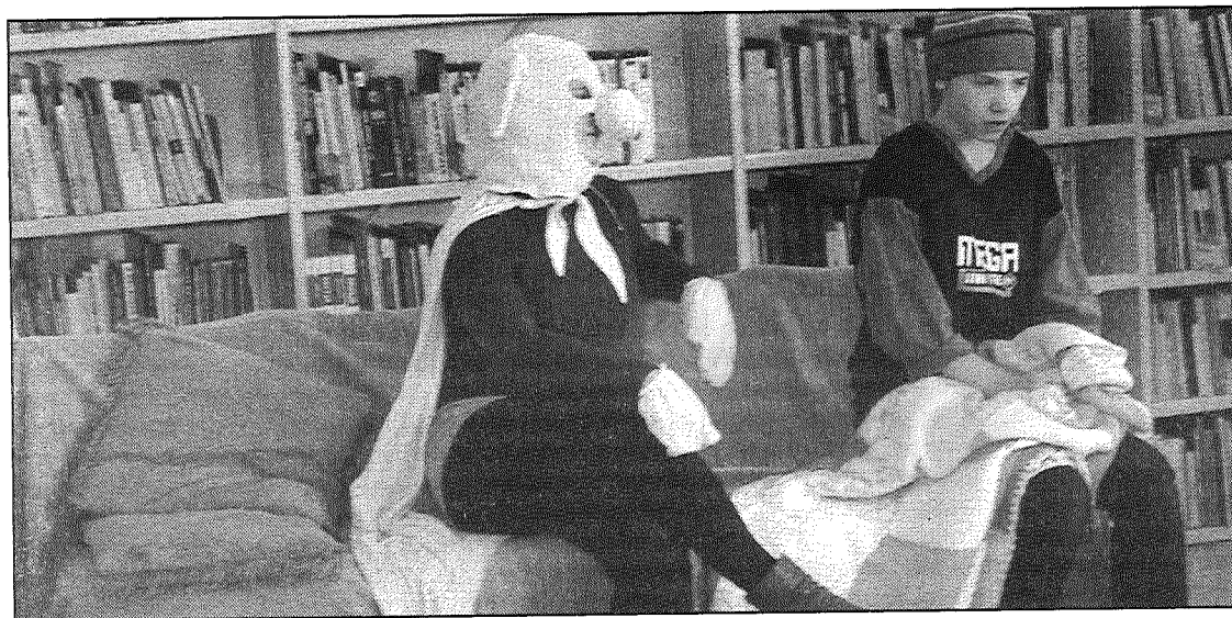
● Cūkmens, kas šonedēļ tikās ar jaunākajiem bibliotēkas lasītājiem, apliecināja, ka vienmēr ir «priecīgs» par katru, kas nevižo atkritumus izmest tiem paredzētajā vietā, bet piemēso apkārtnei.