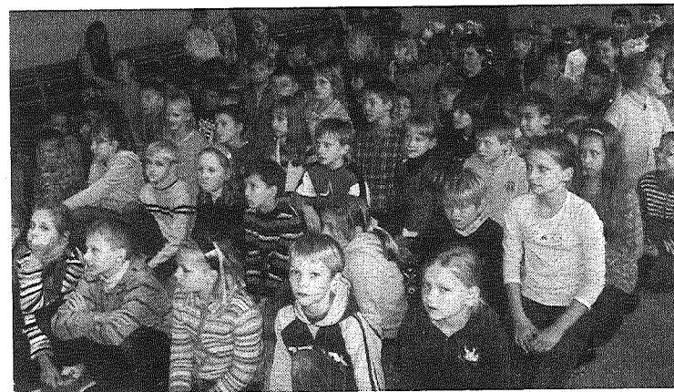
● Ar aizrautību skolēni sekoja neparastajām angļu valodas mācīšanas metodēm.