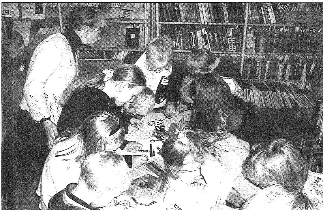
● Sākumskolas bērni Sutru bibliotēkā Ziemeļvalstu bibliotēkas nedēļas pasākumā «Karš un miers pasākās, stāstos un īstenībā».

Pēcpusdienas stundas bibliotēkā tika atvēlētas lielākajiem bēr-