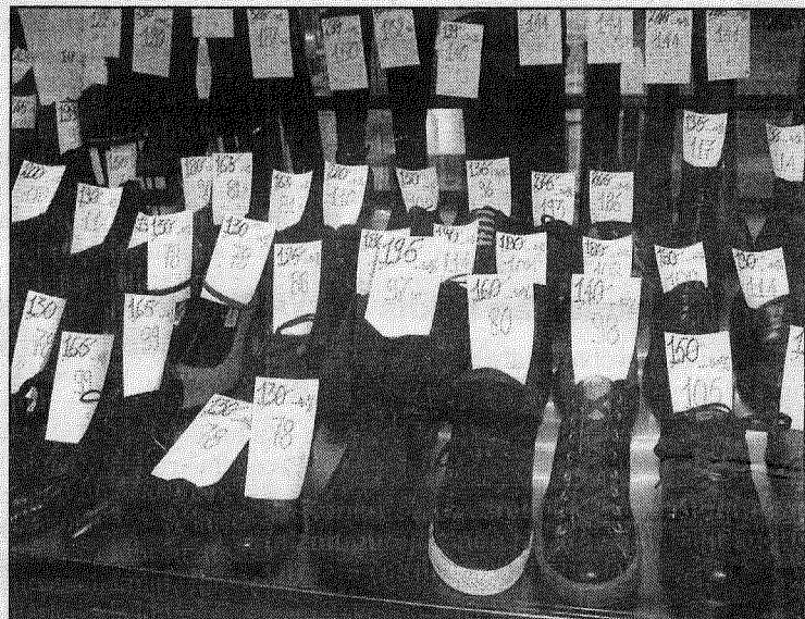
● Atlaides, atlaides... Tomēr cenas veikalos ir visai kodīgas. Nezinu, vai kāds no mūsējiem riskētu iegādāties kaut ko līdzīgu kedām par gandrīz simts eiro.

nieku organizāciju apvienība, kas pārstāv lauksaimniecības kooperatīvu intereses Eiropas Savienības un starptautiskās institūcijās. Dibināta 1959. gadā, kā biedrs no Latvijas tajā ir Latvijas Lauksaimniecības kooperatīvu asociācija.