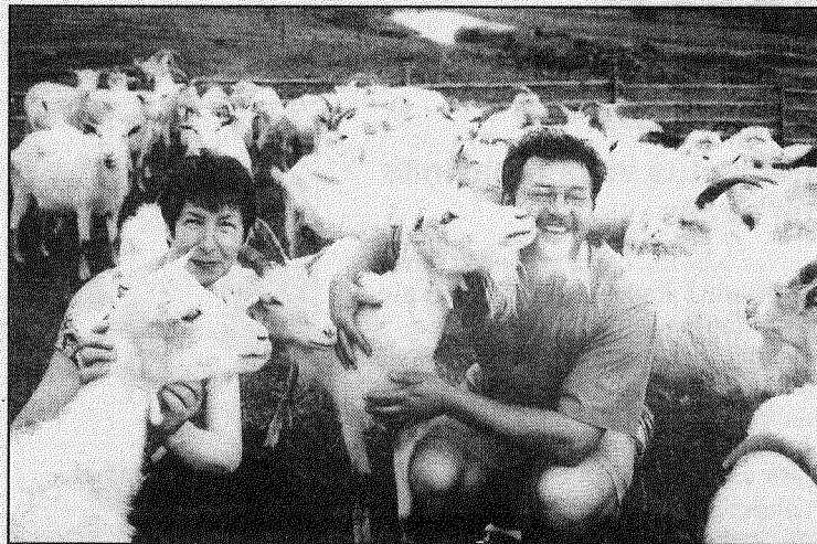
● COGECA dibināšanas 50. gadadienai par godu pērn izdots fotoalbums. Arī COPA — COGECA mitnē redzama fotoizstāde, kurā pamanijām attēlus no Latvijas. Šis milīgās kaziņas un to īpašnieki prezentē Latvijai. Lietuvieši jutušies apbēdināti, jo Lietuvu raksturo fotogrāfija, kurā redzams bērtis ar zirgvilkmes siena grābekli pļavā.