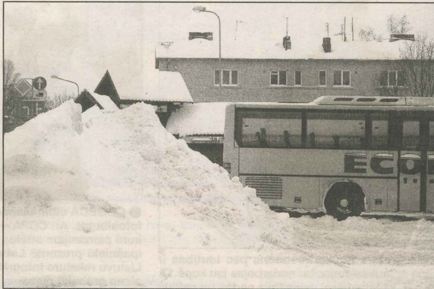
Preiļu autoostas stāvlaukumā biežā kārtā sasnigušā sniega dēļ grūti bija gan pasažieriem, gan autobusu vadītājiem. Sastumtā sniega kaudze tagad sniedz vairāku metru augstumu.

Ceļu tīrīšanai novada pagastos tiek izmantota pašvaldības rīcībā esošā tehnika, traktori MTZ un T-150. Vairākus darbus rit lēnāk, tomēr pamazām viss paveikts. Sākumā gan sniegs nošķūrēts uz ceļiem ar lielāku satiksmes intensitāti, lai pieaugušie varētu tikt uz darbu,