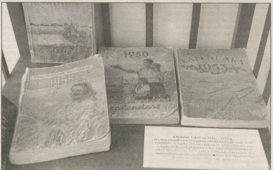
● Izstādē «Kalendāru pasaule» skatāmi «Tāvu zemes kalendārs» eksemplāri, kas iznākuši 1943., 1944., 1947. gadā un jaunāki, kā arī tematiskas gadagrāmatas.

Izstāde sniedz bagātīgu izziņas materiālu, tai pievienotas arī muzeja darbinieku sagatavotas puzzles ar dažādu Preiļu pilsētas objektu attēliem. Uz sienas novietota liela kalendāra lapa ar februāra datumiem, un apmeklētājiem ir iespēja ar klāt pievienotajām puķītēm, lapiņām, vai figūrī-