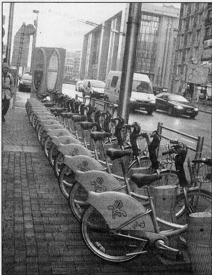
● Divriteņi ir viens no populārākajiem pārvietošanās līdzekļiem Briselē. Iemet naudiņu automātā, paņem vejuku un brauc, kur tev tik. Acimredzot divriteņu zādzības tur nav populāras.