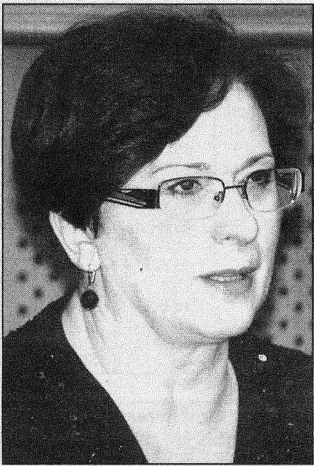
● «Mudiniet cilvēkus būt ļoti prasīgiem pret politiķiem. Šogad, tuvojoties Saeimas vēlēšanām, viņi būs īpaši dzirdīgi.» žurnālistus mudināja Eiropas Parlamenta deputāte Sandra Kalniete.

miteja, pārstāvam savas valstis un esam daļa no Eiropas sabiedrības. Prieks, ka lēmēji mūsos ieklausās.