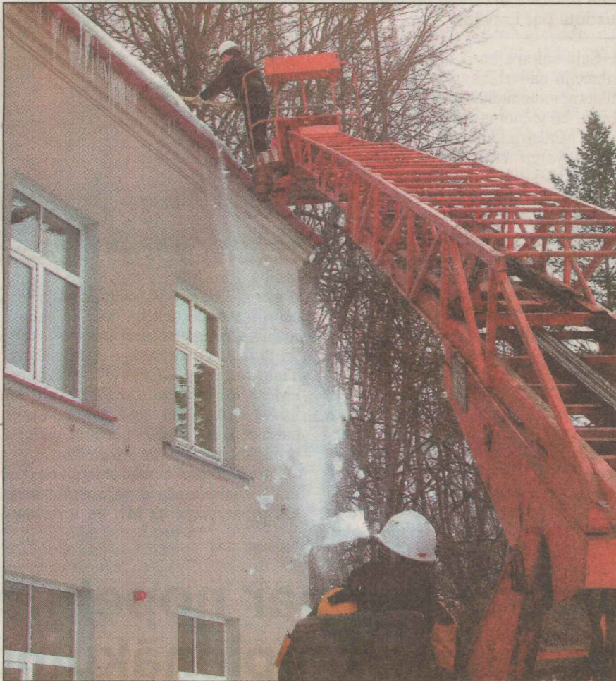
● SIA «Preiļu saimnieks» darbinieki ar autoceltni palīdzību atbrīvo no sniega un lāstekām Preiļu novada domes ēkas jumtu.