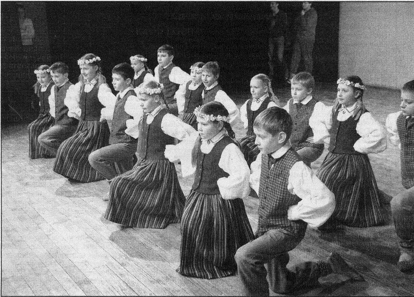
● Novadu skolu deju kolektīvu vietējā skatē uz skatuves dejotāji no Rožupes.

Otrdien, 16. februāri, Preiļu novada kultūras centru pieskandināja deju mūzika un soļu dipona, bet uz skatuves savērpās tautisko svārku virpulis. Plivoja matu lentas bižu galos, mazāki un lielāki dejotāji centās nesajaukt soļus un deju rakstus, bet vērtēšanas komisija, starpnovadu deju kolektīvu (pieaugušo) virsvadītājas Silvijas Kurtiņas vadībā vērigi sekoja katras dejas izpildījumam. Preiļos notika bijušā rajona skolu deju kolektīvu skate, padarītā darba pirmais novērtējums pirms galvenās skates, uz kuru ieradīsies valsts žūrija no Rīgas un kas notiks 7. martā, arī Preiļos.