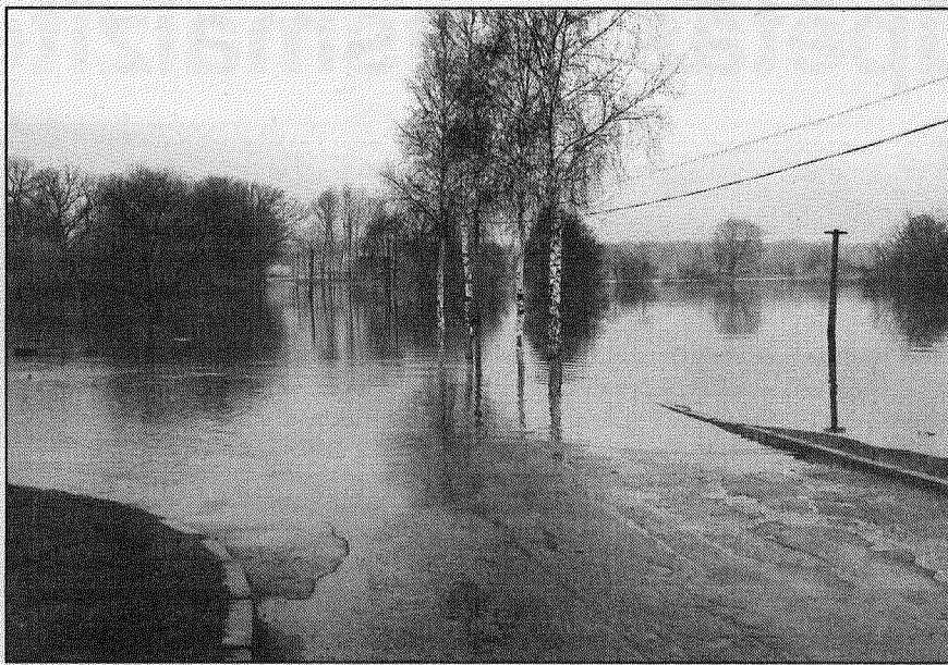
● Tā izskatās Domes iela, kas ved uz Latgales mākslas un amatniecības centru. Zem ūdens — arī līvāniešu iecienītais svētku svinēšanas laukums (pa labi).