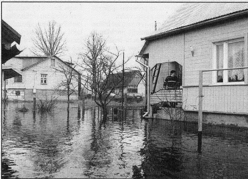
● Palu ūdeņu līmenis Līvānos joprojām ceļas.

vajadzības, tiekot piešķirti līdzekļi, lai nodrošinātu palīdzības sniegšanu saistībā ar plūdiem.