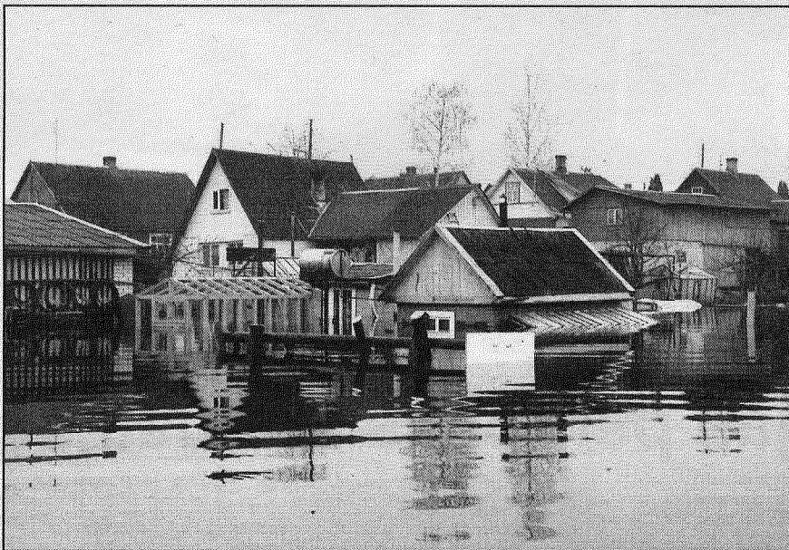
● Upe līvāniešiem rāda savu varenību, bet vislielākos zaudējumus cieš Celtuves ielas iedzīvotāji.