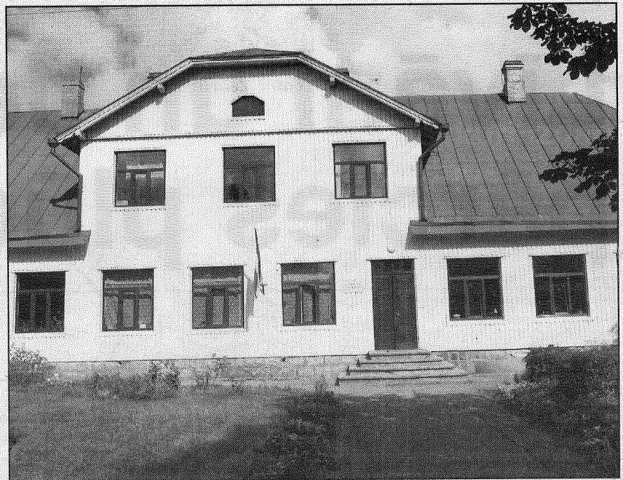
● Šī gada maijā Aizkalnes pamatskolā zvans uz stundu atskanēs pēdējo reizi. Pieņemts lēmums par skolas likvidāciju.

Aizkalnes pamatskolas pārstāvis izteica satraukumu par ciemata kā vēsturiski bagātas apdzīvotas vietas tālāko nākotni. Skola — tā ir dzīvība. Ja nebūs sko-