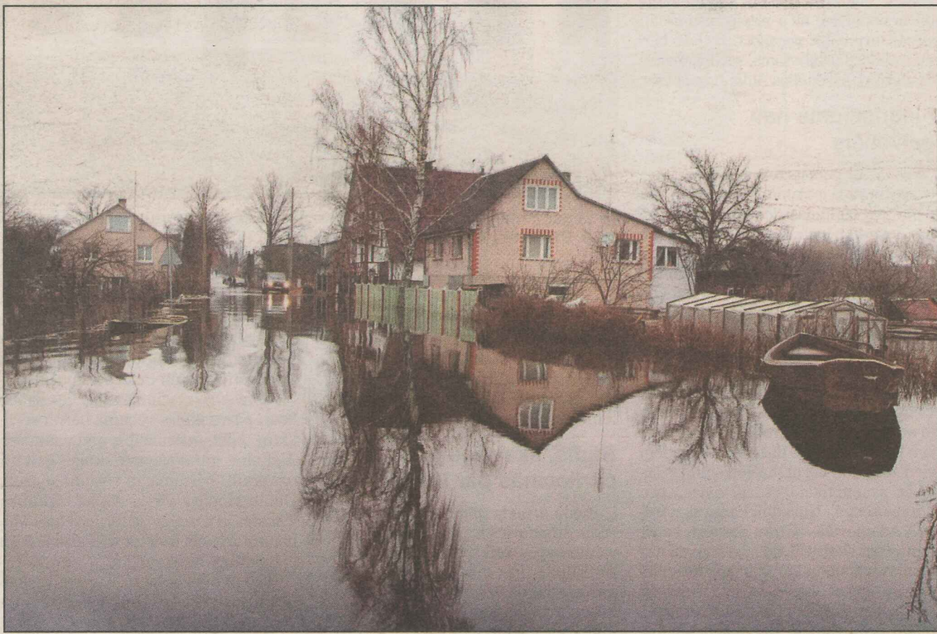
● Daugavas ūdeņi Celtuves un Kurzemes ielā.