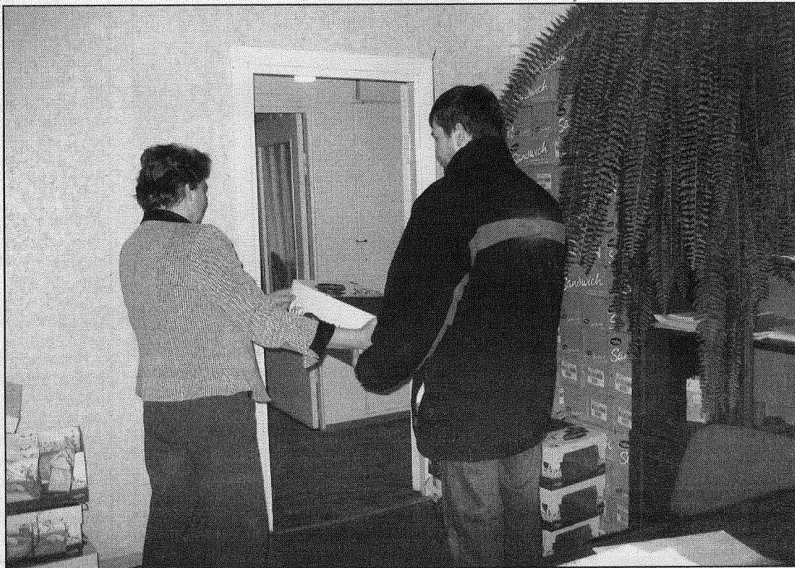
● Sausmaizīšu izsniegšana Rožupes pagasta pārvaldē.

Sausmaizīšu sūtījums sadalīts novada pagastiem, tās ar sociālo darbinieku palīdzību var saņemt trūcīgās personas Turku, Rožupes, Sutru, Rudzātu un Jersikas pagastos, kā arī Livānos. Dodoties pēc sausmaizītēm, līdz jāņem pase un izziņa par trūcīgās personas (ģimenes) statusu. Sausmaizītes ir sendviču veidā, ar sēņu pastas pildījumu vidū. Aprīļa beigās ar Sarkanā Krusta starpniecību Livānu novadā trūcīgajiem sāks izsniegt Eiropas Komisijas apmaksātās pārtikas pakas. Savukārt ar Livānu biedrības «Baltā māja» starpniecību var saņemt produktus personas un