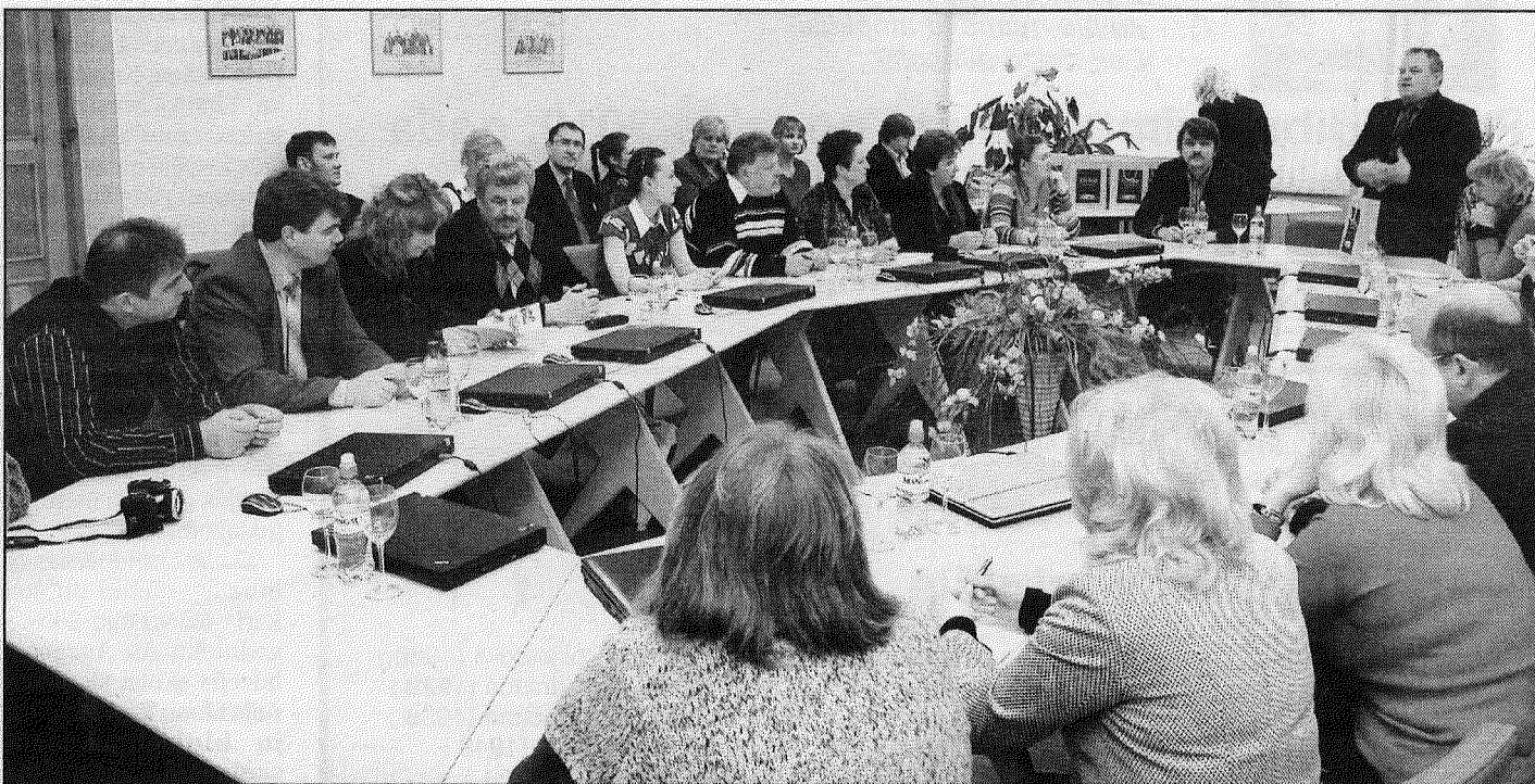
● Līvānus pieredzes apmaiņā apmeklējuši daudzi, taču Baltkrievijas pašvaldības delegācija izcēlās ar dzīvu un neviltošu interesi par visu notiekošo. Dažādu jomu speciālisti centās nodibināt kontaktus, lai veidotu sadarbību. Tā, piemēram, folkloras kopa «Turki» saņēma ielūgumu viesoties Baltkrievijā.

Ar lielu interesi baltkrievu apskatīja Līvānu stikla muzeju, jo līdzīgas ražotnes darbojas arī Baltkrievijā. Viesi puda nožēlu par to, ka vācu īpašnieki ir noveduši rūpniecību līdz bankrotam, un veltīja atzinīgus vār-