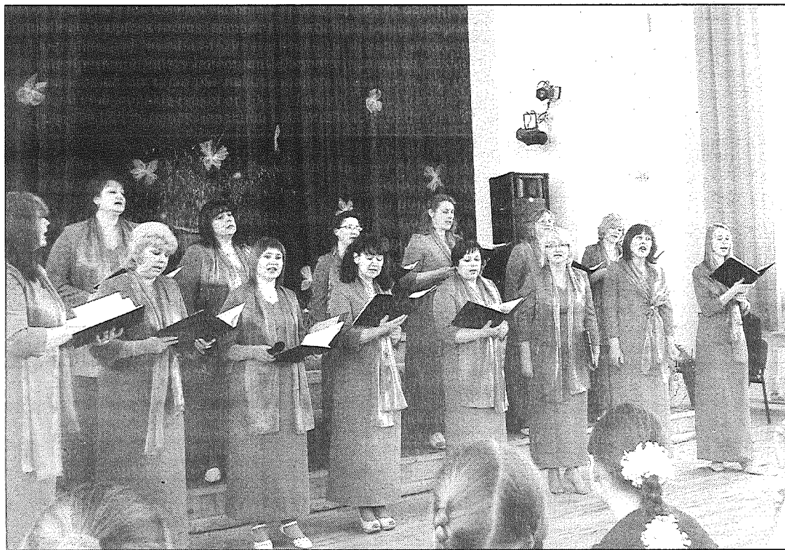
● Skaistas un elegantas novada domes sagādātajos tērpos uz skatuves savā jubilejas koncertā pagājušās nedēļas nogalē stājās Aglonas sieviešu vokālais ansamblis. Dziedot viņas priecē citus un uzņem enerģiju pašas.

Aglonieši un citi, kas klausījušies ansambļa uzstāšanos, atzīst, ka dziedātājas vienmēr cenšas pārsteigt ar jaunām idejām. Gan skatītāju zālē, gan brīvdabas estrādē ikreiz tiek pieskandinātas ar teju vai visu mūzikas žanru