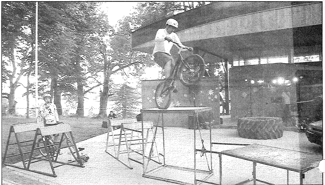
● Uzstājas velotriālisti.