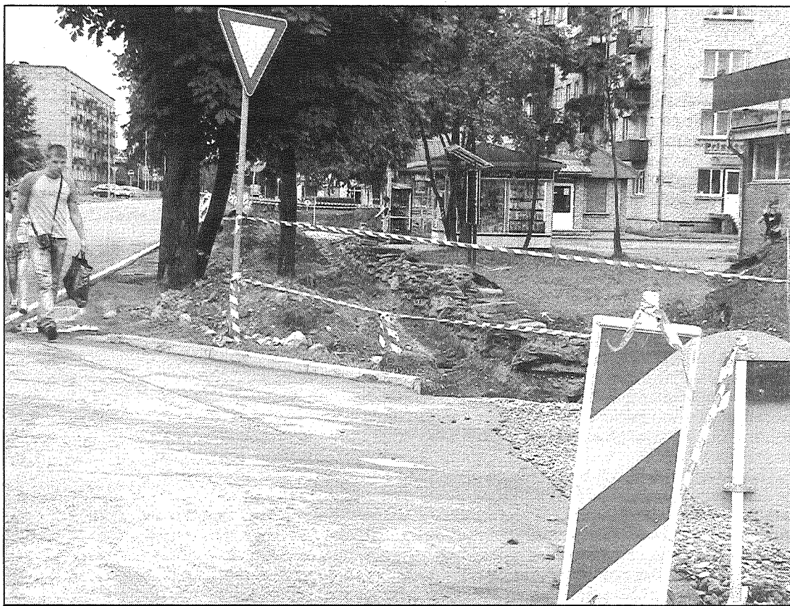
● Ietvju rekonstrukcija Rīgas ielā posmā no Rūpniecības līdz Zaļajai ielai paredz arī divu jaunu gājēju pāreju izveidi, viena no tām pēc iedzīvotāju lūguma būs iepretim veikalam Maxima.