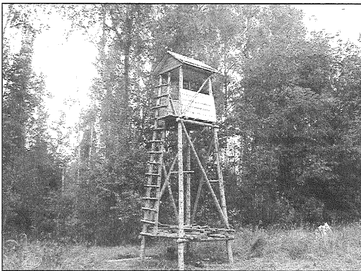
● Ja meža dzīvnieki iecienījuši jūsu kartupeļu laukus un labības sējumus, medniekiem derētu ierīkot šādu medību torniti, no kura vaktēt postītājus.

Savukārt medību iecirkņa plāns ir medību tiesību lietotāja sagatavots un Valsts meža dienestam iesniegts dokuments, kas satur