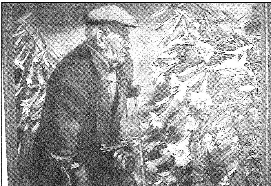
● Selekcionārs, fotogrāfs un kolekcionārs Pēteris Upītis dzimis 1896. gadā un miris 80 gadu vecumā, atstājot aiz sevis unikālu — dzīvu un ik pavasari atkal no jauna plaukstošu — mantojumu.