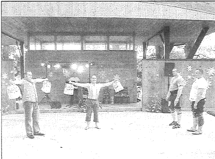
● Vietējie vīri spēku demonstrēja, turot izstieptās rokās iepakojumus ar minerālūdeni.