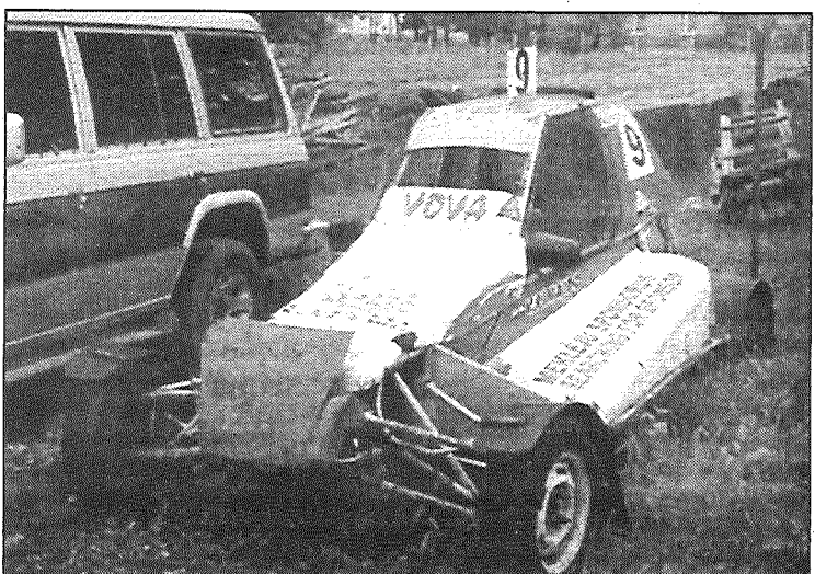
● Autobraucēja Rimaido dāvāto veco bagiju atjaunos jauniem startiem.

Jau otru gadu Krāslavā notiek vieglo automašīnu sacensības autokrosā «Krāslavas kauss», ko ar Krāslavas novada domes atbalstu rīko biedrība «Krāslavas auto — moto sporta klubs». Pērn pasākums izdevās godam un guva gan skatītāju, gan pašu autobraucēju atsaucību, taču šogad pasākums notika jau ar lielāku vērienu, pulcējot gan Krāslavas jaunos un pieredzējušos sportistus, gan autobraucējus no Daugavpils, Rīgas un Ludzas.