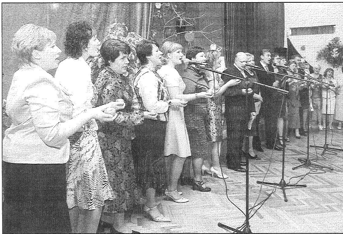
● Dziedošu apsveikumu Vārkavas vidusskolas 90. dzimšanas dienas viesiem bija sagatavojuši pašreizējā pedagogo saime.

Šajā mācību gadā Vārkavas vidusskolā mācās 145 skolēni, 11 bērni apmeklē pirmsskolas izglītības grupu. Skolā strādā 22 pedagogiskie darbinieki, deviņi tehniskie darbinieki. Skola iesaistījies projektos: «Vārkavas novada mutvārdu folkloras pūrs»; biologu nometnes «Dabas skola»; KNHM un Vārkavas novada domes mazo grantu projektā «Nav komunikācijas, nav sadarbības», kura ietvaros tika