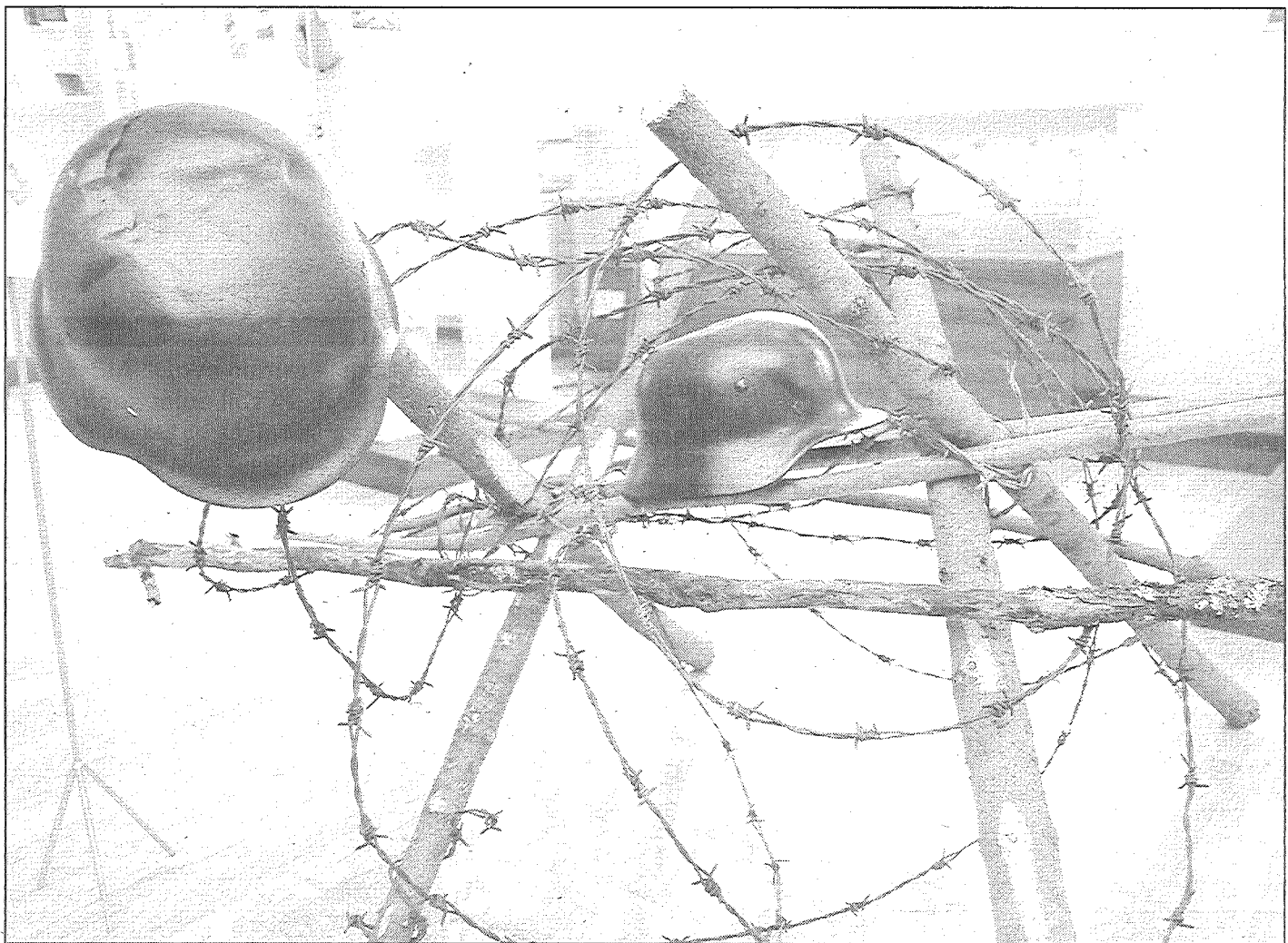
● Preiļu 1. pamatskolas novadpētniecības un vēstures pulciņa sagatavotais objekts «Mūžam vienoti un brīvi» Preiļu vēstures un lietišķās mākslas muzeja izstādē «Ir Latgale mūsu...», kas veltīta Latvijas un Latgales brīvības cīņām.