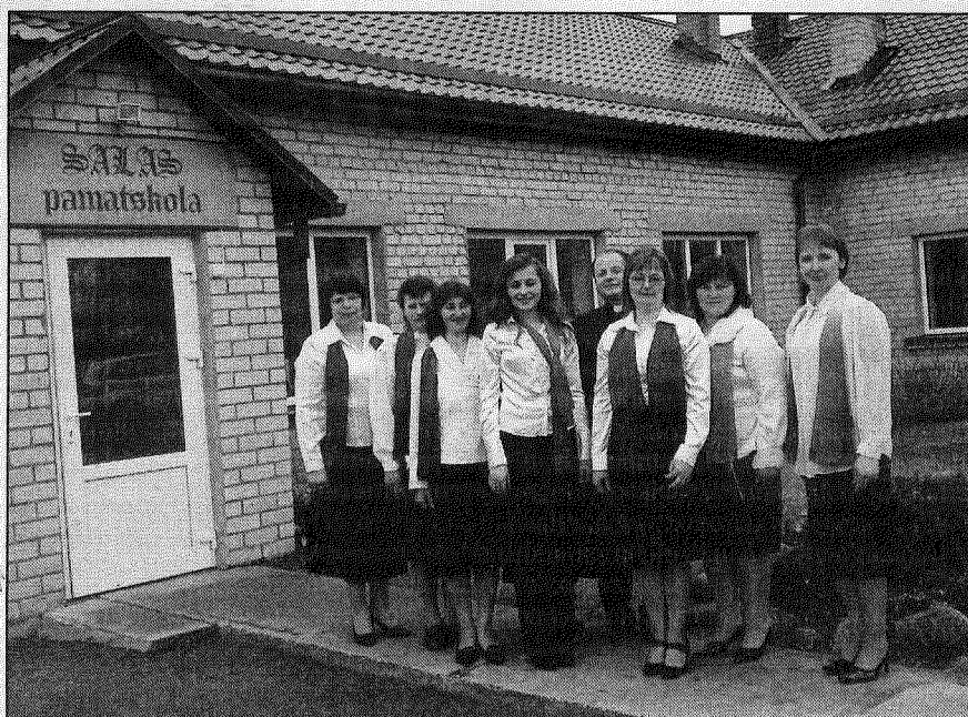
● Vokālais ansamblis «Maganēis» ir pagastā iemīļots kolektīvs, kas izpilda ne tikai latgaliešu tautas dziesmas, bet arī tautā iecienītus šlāgerus.