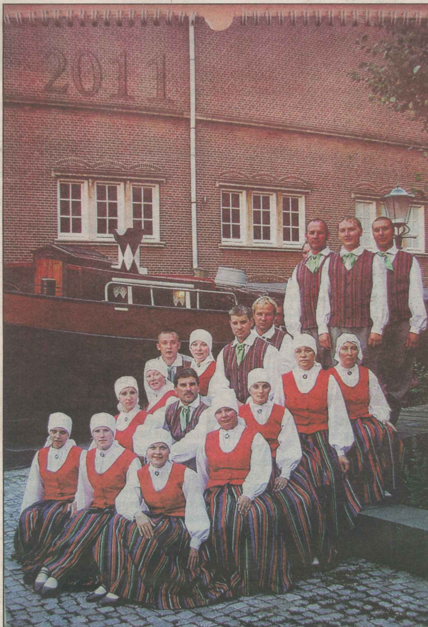
● Riebiņu novada Stabulnieku kultūras nama vidējās paaudzes deju kolektīva gatavotais pārsteigums draugiem — 2011. gada kalendārs un paši dejotāji.