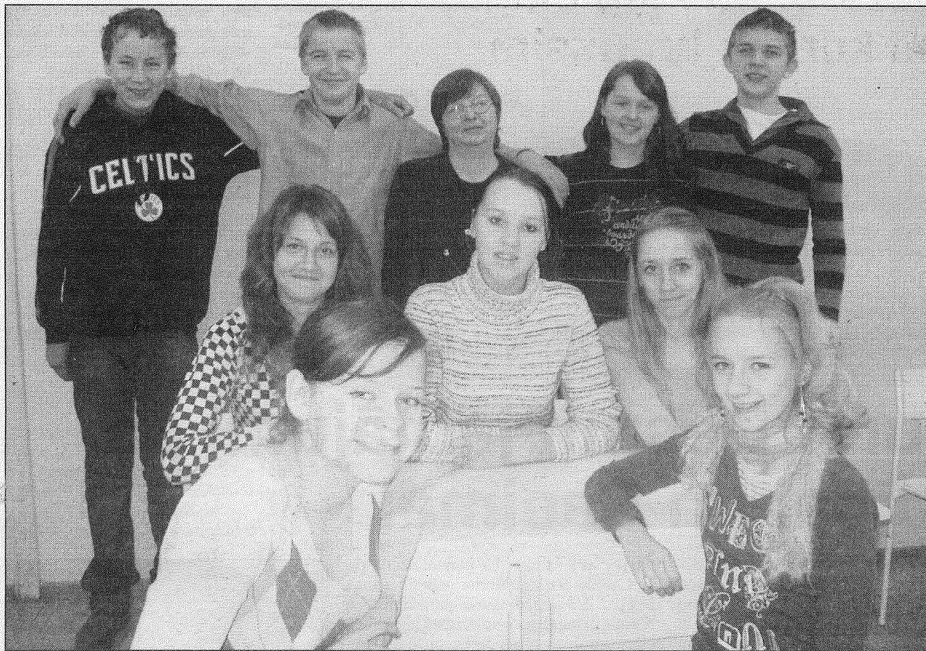
● Jaunsilavas pamatskolas 9. klases skolēni atzīst, ka uzvara konkursā «Kas notiek?» devusi ļoti daudz — zināšanas, prasmes, gandarījumu, taču galvenais — pārliecību — mēs varam. Un tā ir fantastiska sajūta!

Laikraksta «Diena» organizētajā mūsdienīgu zināšanu konkursā «Kas notiek?», kurš risinājās 22. oktobrī, Latgalē par uzvarētāju kļuvis Jaunsilavas pamatskolas 9. klase. Šogad konkursā piedalījās 18 549 skolēni no 671 skolas, informēja Anna Muhka, «Dienas Mediju» sabiedrisko attiecību vadītāja.