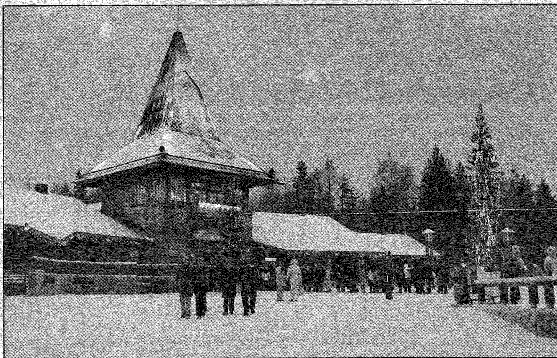
● Santa Klaus mītnes Lapzemē.

Rīgā pilnā sparā rit pasaules galvenā Santa Klaus mītnes celtniecība pēc viņa Lapzemes mājas parauga. Santa Klauss uz savas rezidences atkāpšanos ieradīsies jau šīs nedēļas beigās — 28. novembrī plkst. 16.