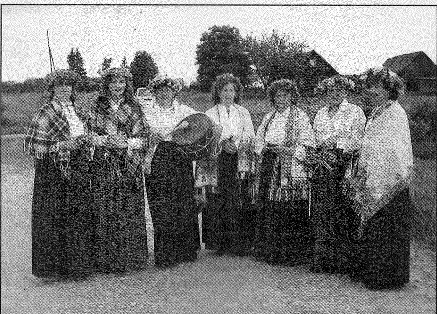
● «Bindaru sievas», kas nesen tikušas pie jauniem tērpiem, klausītājiem prot sagādāt ne vienu vien pārsteigumu.