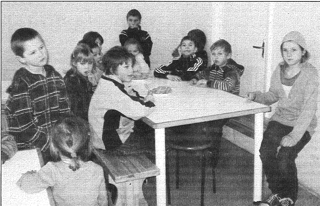
● Svaigi dārzeņi lieliski garšo Salas pamatskolas skolēniem.

tos nomazgā, pēc tam sadala pa šķīvīšiem un noliek uz galdiem ēdnīcā. Pēc pirmās stundas ābolus saņem 1. — 3. klašu skolēni, pēc otrās — 4. — 6. klašu bērni. Visiem garšo lieliski, un mums par to prieks, kaut arī augļu dalīšana sagādāja papildus darbu, teica ēdnīcas vadītāja.