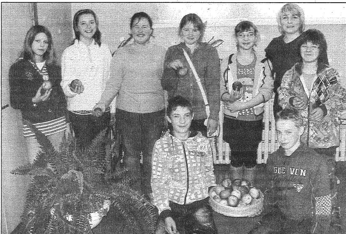
● Pašā ziemas viducī, vīrusu laikā, kas gan var būt labāks par šo — vitamīniem bagātu, Latvijā augušu ābolu? Tos ar apetīti notiesās Vārkavas pamatskolas sestklasnieki.