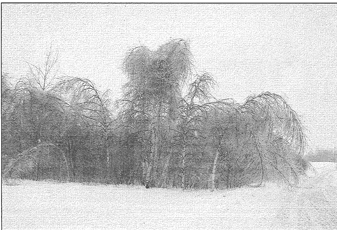
Sniegs un apledējums nodarīja lielu postu ne tikai pieaugušām mežu audzēm, bet arī jaunaudzēm un birstaudzēm. Visvairāk cieta bērzu audzes līdz 20 gadu vecumam. Tās ir nocērtamas kailcirtē un pilnībā atjaunojamas.

«Parasti snieglice ir neatgriezeniska, taču vietām tika novērota arī netipiska parādība — liela daļa koku vairāk vai mazāk iztaisnojās,» stāsta konsultante. «Šobrīd jāapseko meža audzes, jānovērtē bojājumu pakāpe un