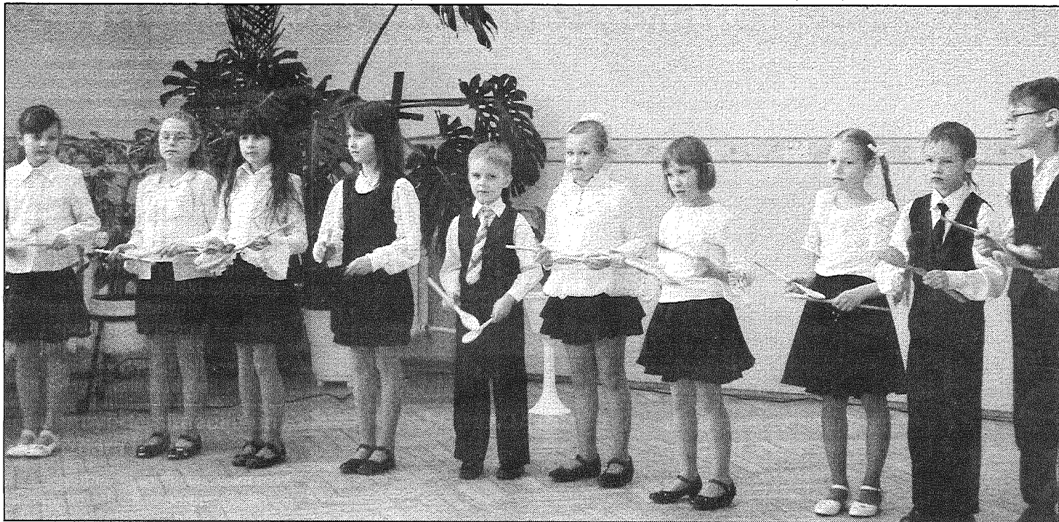
● Vokālās studijas «Spurgaliņas» jaunākā grupa konkursā «Balsis» Līvānu novada kārtā atzīta par labāko.

Otrās pakāpes diplomus saņēma Rožupes pamatskolas un bērnu un jauniešu centra 5. — 9. klašu vokālais ansamblis un Līvānu 2. vidusskolas meiteņu trio (vada Inese Upīte). Līvānu 2.