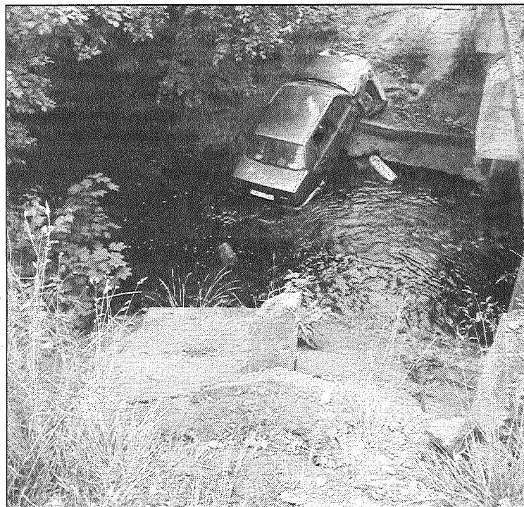
Liktenis sargājis kādu 1991. gadā dzimušu vīrieti, kurš pēc nopietnas autoavārijas Aglonas pagastā guva traumas un palika dzīvs.

Kā «Novadnieku» informē Valsts policijas Latgales reģiona pārvaldes priekšnieka palīdzē Inguna Pužule, 19. jūnijā ap pulksten 6.10 Aglonas pagastā ceļa Krāslava — Preiļi — Madona 35. kilometrā minētais vīrietis, vadot automašīnu Volvo 460, visticamāk, nebija izvēlējis drošu braukšanas ātrumu. Rezultātā transportlīdzeklis šķērsoja pretējā virziena kustības joslu, tad auto nobrauca no ceļa braucamās daļas, pārlidoja pāri Tartakas upei un piezemējās, ietriecoties upes pretējā krastā.