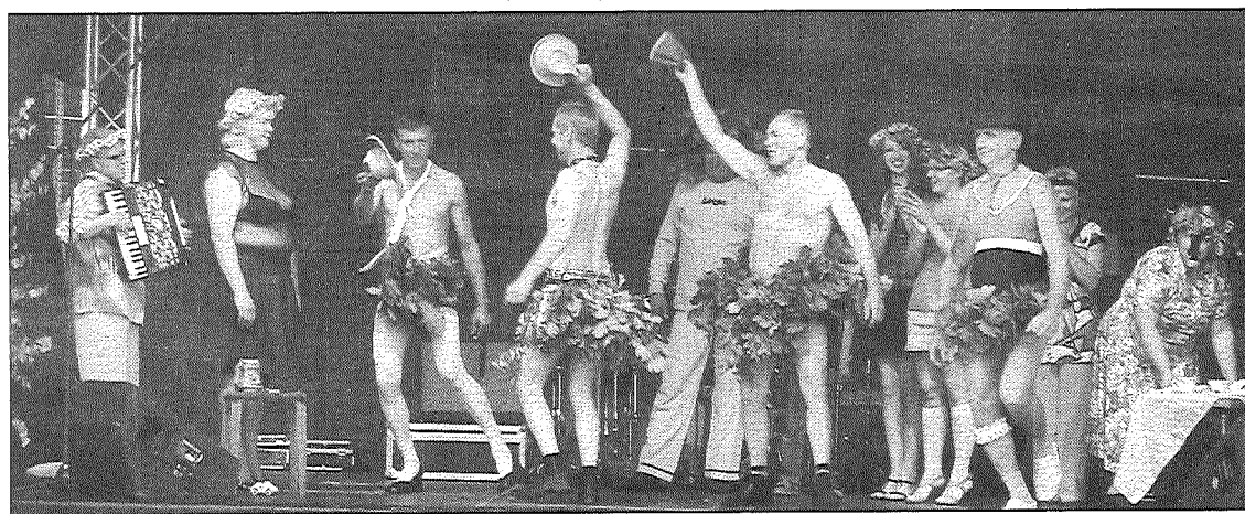
● Upmalas teātra draugu kopas vīriešu striptizam skatītāju pulkā visvairāk uzgavilēja kundzes.