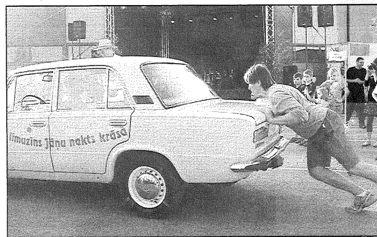
● Salonā pie stūres dāma, pašam piepūsti vaigi, un — aiziet!