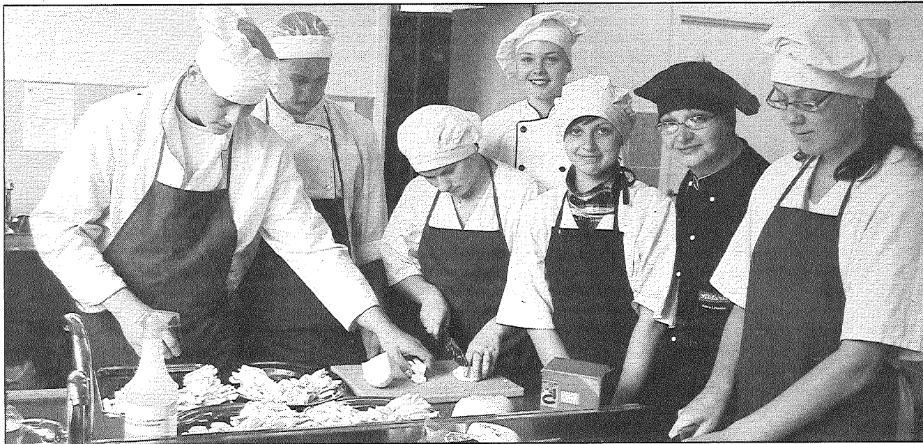
● Meistara dienā topošie pavāri Preiļos gatavo siera plati.

Biedrība «Siera klubs» divas dienas strādāja ar Latgales topošajiem pavāriem — profesionālo skolu audzēkņiem Preiļos un Dagdā, kur bija organizētas Meistara dienas, pievērsot viņu uzmanību vienam no izcilākajiem produktiem — sieram — un mācot par tā izmantošanu ēdienos. Vairāk nekā 200 jaunieši noskatījās dokumentālo filmu «Piena deģa», noklausījās lekcijas par siera šķirņu daudzveidību, par piena produktu nozīmi uzturā un veselībā, par pavāra profesijas svarīgumu, tikās ar siera ražotājiem un citiem uzņēmējiem.