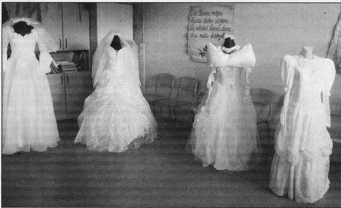
● Līgavu kleitu izstāde raisa atmiņas par laimīgākajām dienām katras sievietes mūžā.