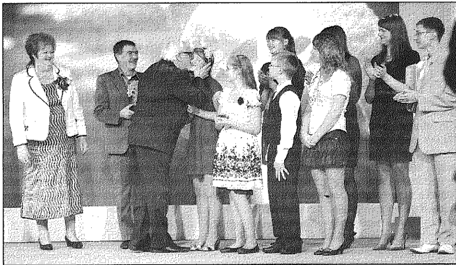
● Šūpulnieku ģimene «Latvijas lepnums» balvas — «Zelta ābeles» pasniegšanas ceremonijā Rīgā.

Kā var sadūšoties pieņemt savā paspārnē pilnīgi svešu, pirms tam nekad neredzētu bērnu, kurš nav nekāds «zelta gabaliņš», jo pirms tam dzīvojis sliktos apstākļos, daudz cietis, redzējis un pārdzīvojis? Esmu skolotāja, esmu radusi strādāt ar bērniem. Man patīk vērot, kā viņi veidojas,