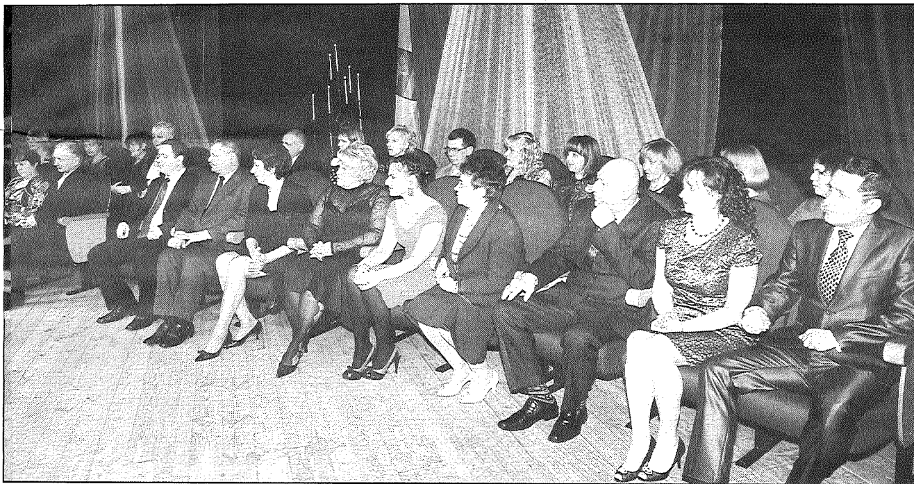
● Atzīmējot Līvānu novada 12. dzimšanas dienu, tika sveikti labākie domes iestāžu un institūciju darbinieki, piešķirot nomināciju «Gada darbinieks». Sveikšanas brīdī visi tika aicināti vienkopus uz skatuves (attēlā).

14. janvārī Līvānu novada kultūras centrā notika Līvānu novada 12. gadu jubilejas pasākums, kurā piedalījās ap 300 pašvaldības, tās iestāžu, struktūrvienību un kapitālsabiedrību darbinieki, viesi un domes deputāti, informē Līvānu novada domes sabiedrisko attiecību speciāliste Ginta Kraukle.