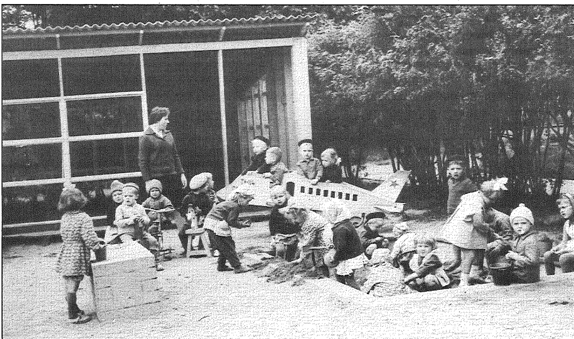
● Padomju laiku bērnība bērnodrēzēs maz ar ko atšķiras Rīgā, Preiļos vai Līvānos — visur bija vienādi rotaļu laukumi, smilšu kastes, lāpstīņas un spainiņi.

1826. gadā parādījās pirmās runājošās un mirkšķinošās lelles,