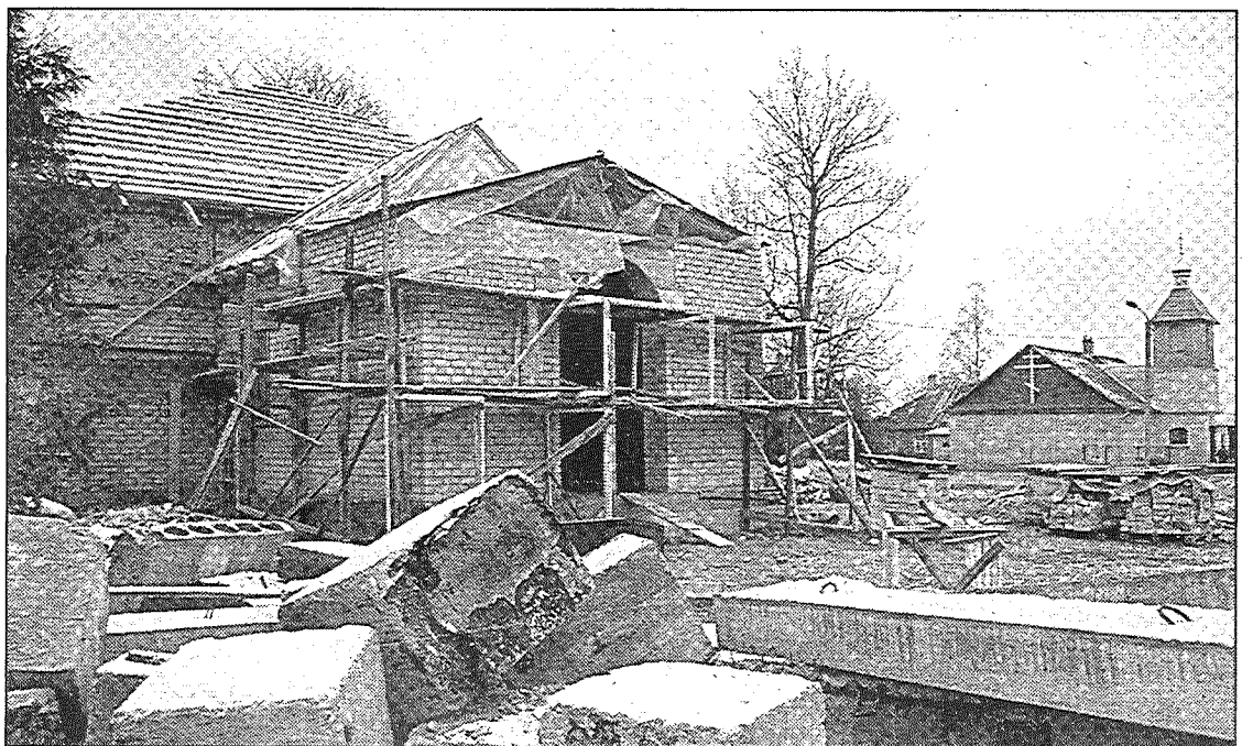
● Šeit būs ieeja dievnāmā.

Kopš 2010. gada vasaras jau paveikts liels apjoms pirmo, vissmagāko darbu. Pamatos ir ielieti simtiem kubikmetru betona, atjaunotas ugunsgrēka sabojātās