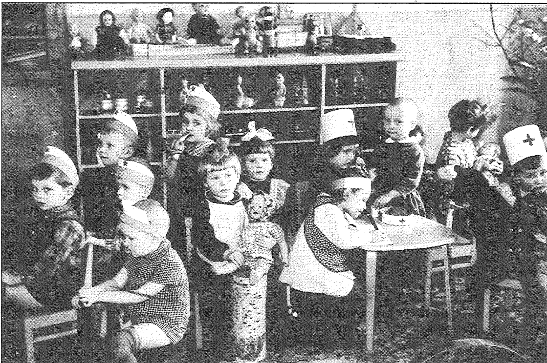
● Nākamie oktobrēni un pionieri no mazām dienām mācījās visu darīt kopīgi — 8. martu, Oktobra revolūcijas gadadienu atzīmēt, arī spēlēties.

tām bija stikla acis, Angoras kazas vilnas vai dzijas mati.