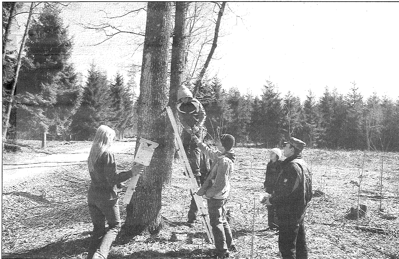
● Jersikas pamatskolas skolēni jau trešo gadu pēc kārtas ar pašgatavotiem putnu būriem sagaida gājputnus. Pašlaik — Putnu dienās — līdzīgas aktivitātes notiek arī citās skolās.

Aprīlis ir gājputnu atgriešanās mēnesis, un par to var pārliecināties katrs, jo pašlaik spārnotie ceļotāji ar savām balsīm pieskandina debesis gan dienā, gan agros rītos, gan nakts stundās. Stārķi pārlūko un pie labo savas ligzdas, dzērves klaigājot met lokus un no augšas nolūko, kur tikamāks klajums, sev zināmos barības laukus atrod meža zosis, gulbji lido pa pāriem un pieskandina pasauli ar melodiskiem «klang, klang». Un kur nu vēl strazdu pavasarīgie sveicienī, cīruļu rosīgie darbi dzimtas turpināšanai, ķīvīšu bravūrīgie saucieni katram, kas iedrošinās pietuvoties viņu apmešanās vietai. Ne velti ārzemnieki, kas ciemojas Latvijā, ievērojuši, ka gaiss pie mums pieskandināts ar putnu balsīm, kas daudzās pārlietu urbanizētajās valstīs jau vairs nav dzirdamas.