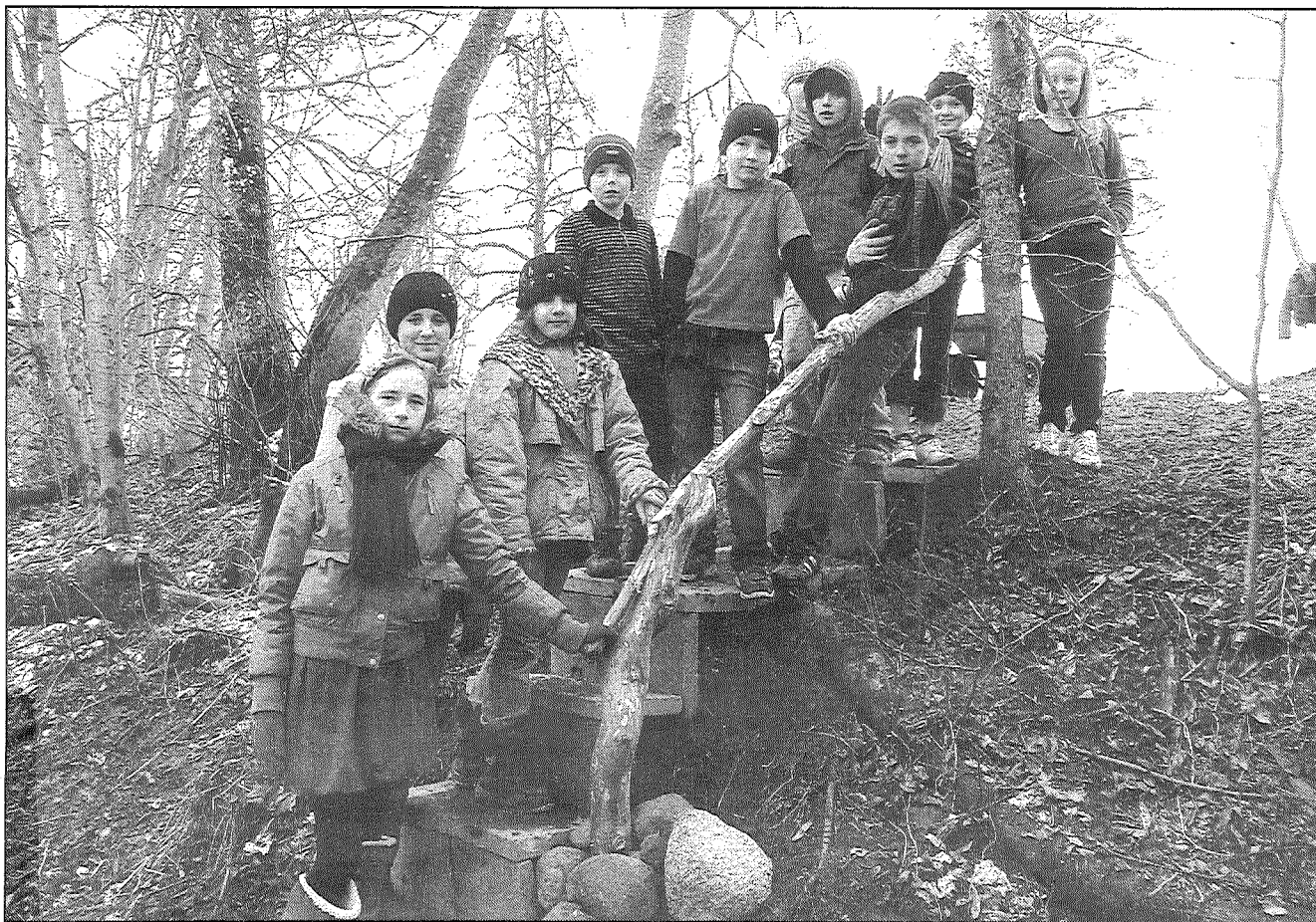
● Jersikas pamatskolas 5. klases skolēni uz pašu iekārtotajām kāpnītēm pie Dzirnava avota, kuru sakopa kopējiem spēkiem.