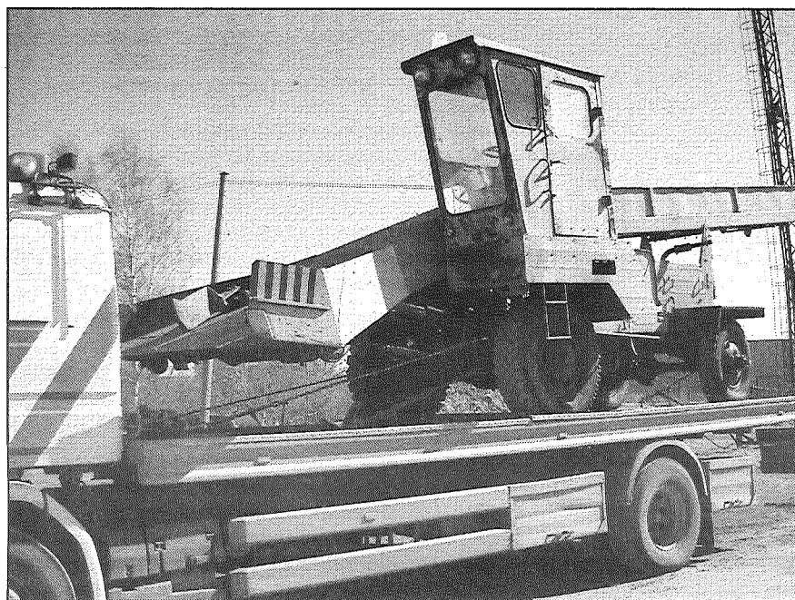
● Vēsturiskā sniega savācēja mašīna novietota uz treilera un gatava ceļam uz muzeju Rīgā.

Šī gada nogalē "Rīgas Motormuzejs" sadarbībā ar SIA "Rīgas satiksme" plāno atklāt pastāvīgo ekspozīciju, kas veltīta Rīgas sabiedriskā transporta vēsturei. Preiļu sniega savācēja pēc restaurācijas, vistīkamāk, tiks izstādīts jaunajā ekspozīcijā, lai prezentētu, kādu transportu Rīgā un citur izmantoja vēl ne tik sen – pirms