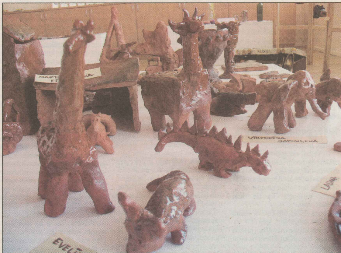
● Ieskats Preiļu bērnu un jauniešu centra pulciņu audzēkņu izstādē «Rokas darba nebijās!».

Pulciņu dalībnieki, dažāda vecuma bērni, mācību gada laikā citīgi filcēja, pārļoja, šuva, adīja, limēja, mezgloja, zīmēja, izšuva, grieza, auda, meistaroja, glez-