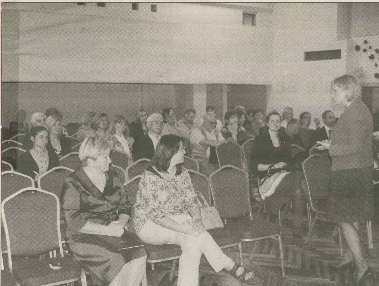
● Vārkavas novada Vecvārkavā notikušajā konferencē «Latgaliešu valoda un latgaliskā identitāte» uzstājas kultūras ministre Žaneta Jaunzeme-Grende.

Ar šādu dziesmu un lepnī pāceltu galvu Vārkavas vidusskolas zēnu ansamblis ievadīja LR Kultūras ministrijas rīkoto konferenci «Latgaliešu valoda un latgaliskā identitāte», kuras dalībnieki pulcējās Vārkavas novada Vārkavas vidusskolas zālē. Konference tika rīkota ar mērķi atrast un piedāvāt risinājumus latgaliešu valodas un kultūras stiprināšanai un popularizēšanai; izstrādāt priekšlikumus šī gada augustā Rēzeknē notiekošajai pasaules latgaliešu konferencē. Konferences plenārsēdē piedalījās kultūras ministre Žaneta Jaunzeme-Grende, 11. Saeimas deputāte, Kultūras ministrijas parlamentārā