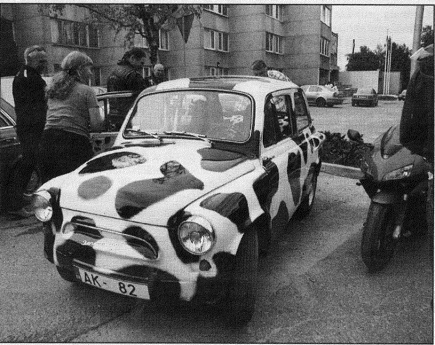
● Īpašu uzmanību citu antīko spēkratu vidū iemantoja ZAZ markas automobilis dalmācieša izskatā.