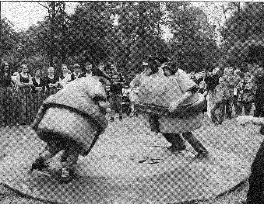
● Cik spēcīgs ir komandas darbs, varēja pārlicināties ikviens, startējot "Sīamas sumo" ciņās.