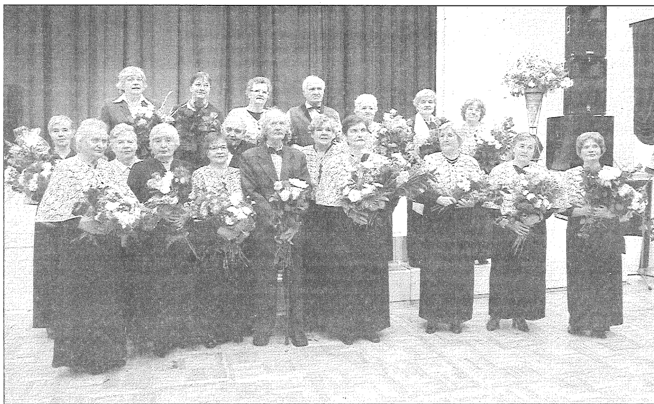
● Stalti, smaidīgi un eleganti – senioru ansambļa “Virši” dalībnieki tādi ir ne vien svētkos, bet arī ikdienā.