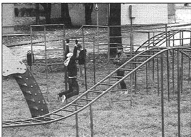
● Līvānieši demonstrē savu muskuļu spēku, Spēka dienas laikā pievelkoties pie stieņa.