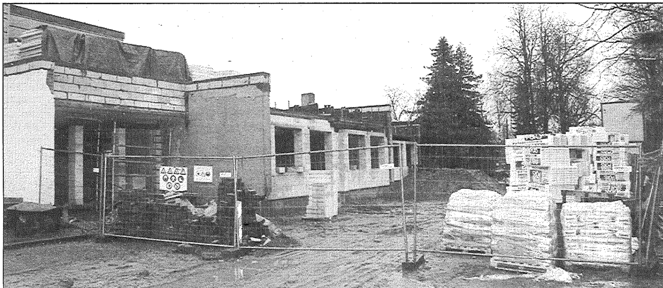
● Riebiņu centrā pilnā sparā rit būvdarbi — tiek rekonstruēta Riebiņu bibliotēka.