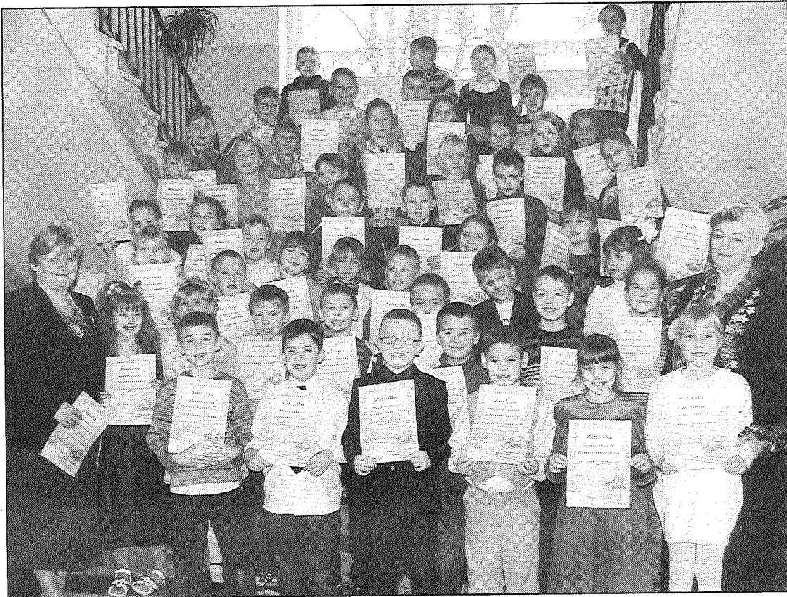
● Izcilnieki mācībās — 1.-4. klašu skolēni.