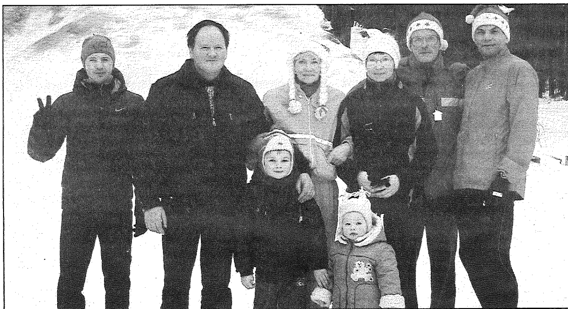
● Līvānu komanda – Vecgada skrējiena dalībnieki.