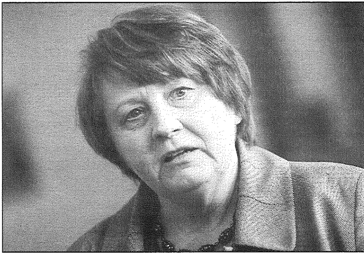
Līdz jūnija vidum ir jāizstrādā koncepcija Valsts zemes fonda izveidei un priekšlikumi efektīvākai zemes izmantošanai, lai

Tāpat 2013. gadā ir jāatrisina jautājumi, kas saistīti ar efektīvāku zemes apsaimniekošanu.