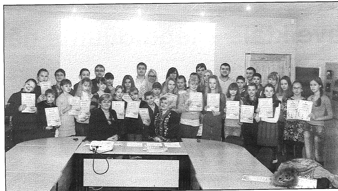
● Skolas lepnums — 5.-12. klašu skolēni.