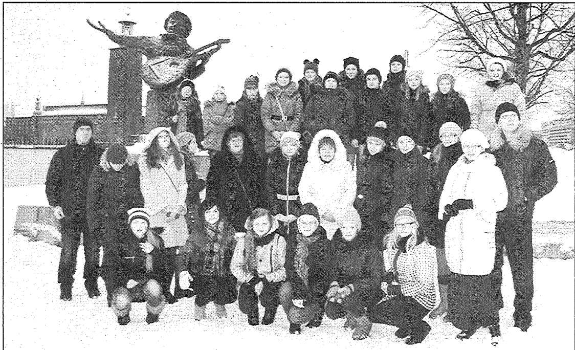
● Aglonas bazilikas kora skolas kora dziedātāji priecājās par sniegto un Ziemassvētkiem saņemto Stokholmu.

Pēc koncerta devāmies gulēt ar patīkamu noguruma sajūtu, bet rītu sagaidījām skaistajā Stokholmā. Ja jau labi strādājām, tad arī labi jāatpūšas, tāpēc noorganizējām ekskursiju pa pilsētu. Iepazinām svarīgākos un populārākos Stokholmas objektus: Nobela prēmijas skulptūru, vēstniecību rajonus, apmeklējām lieliskus skatu punktus, bija laiks arī brīvsolim. Ziemassvētkiem sapostajā Stokholmā bija neskaitāmi svētku tirdziņi ar noskaņu radošiem neciņiem. Ne velti šo pilsētu apmeklē tūk-