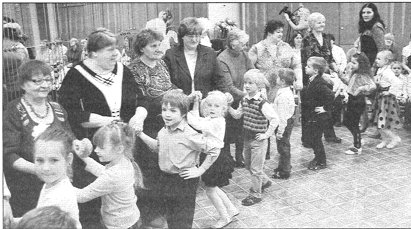
● Mazbērnu un vecmāmiņu kopīgā rotaļa pēc labi paveikta darba.