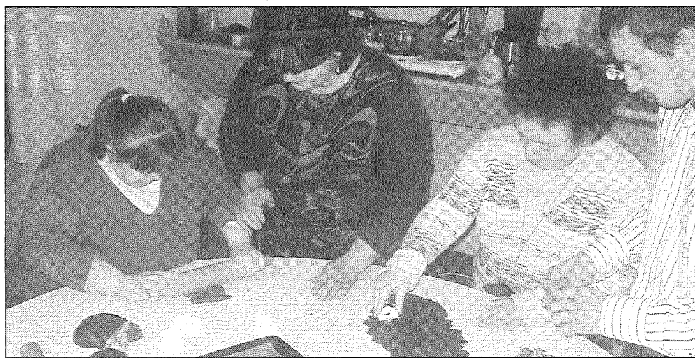
● Dienas centra nodarbībās top arī gardas lietas.

Nemainīgi liela interese ir par aušanas nodarbībām — izveidojies čaklu sievu pulciņš,