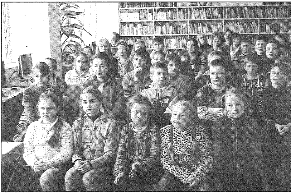
● Čaklie lasītāji un eksperti bērnu žūrijas noslēguma pasākumā Preiļu galvenās bibliotēkas bērnu literatūras nodaļā.