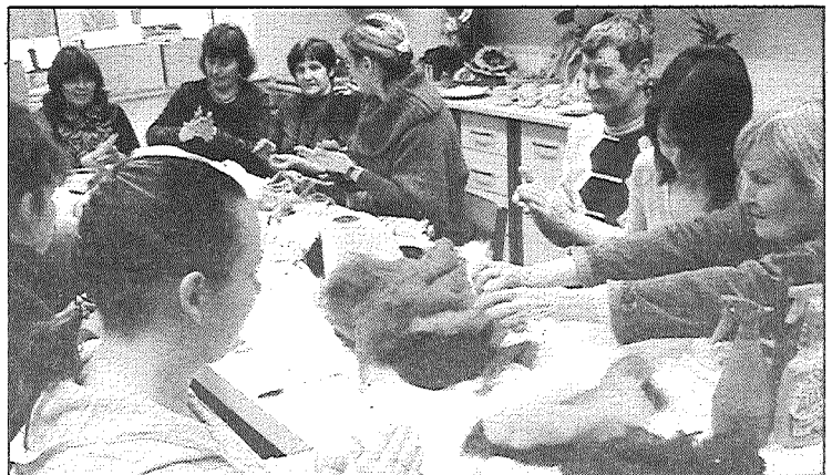
● Jau pirmā filcēšanas nodarbība Jersikas pamatskolā piešķirēja iedzīvotāju interesi.

Ļoti interesanti Jersikas pamatskolā aizritēja arī aizvadītā piektdiena, kad skolēni atzīmēja Sniega dienu. Tagad sporta laukumā «sapulcējies» sniegavīru bars, ko bērni todien savēla. Kaut gan