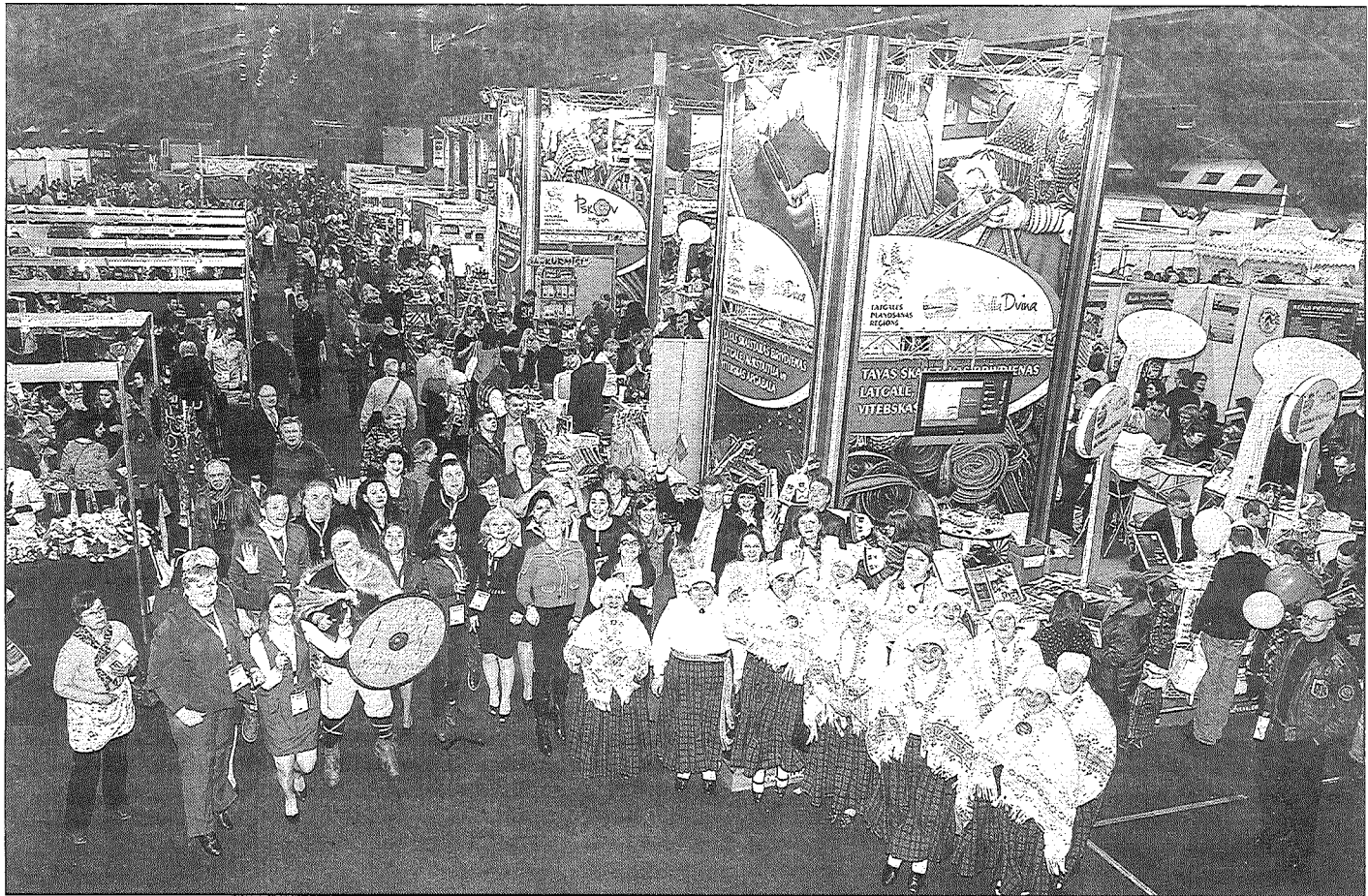
● Latgales reģiona stands starptautiskajā tūrisma izstādē «Balttour 2013» bija viens no visatraktīvākajiem, muzikālākajiem un «garšīgākajiem». Par to parūpējās Latgales plānošanas reģions, pašvaldības un tūrisma nozare iesaistītie uzņēmēji.

Latgale «Balttour 2013» izstādē šogad piedalījās kopā ar kaimiņiem un sadarbības partneriem divu projektu ietvaros. Projekts «Tour de Latgale and Pskov» tiek īstenots kopā ar Igaunijas un Krievijas par-