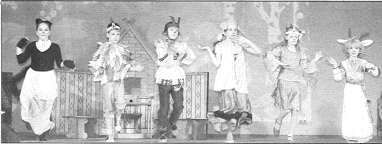
● Skats no Līvānu 2. vidusskolas bērnu iestudētās izrādes «Kaķu nams».