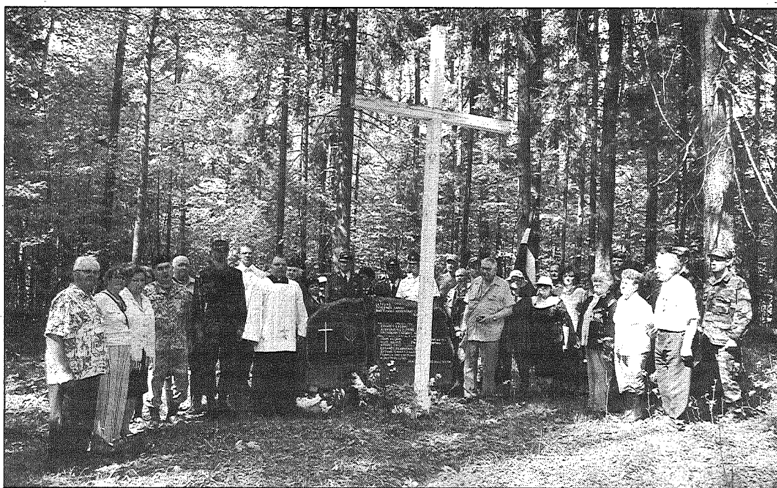
● Piemiņas zīmes atklāšanas dalībnieki, skatot patriotiskām dziesmām un runām, taču dziļām skumjām un smeldzi sirdī godināja nacionālo partizānu piemiņu. Tālaika notikumu un politiskā situācija ir viena traģiskākajām Latvijas vēstures lappusēm, kas joprojām ir pretrunu, aizlieguma, baiļu, neparvaramas vilšanās sajūtas un sāpju avots.