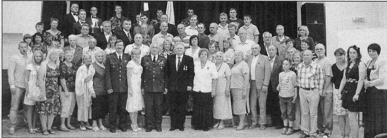
● Kopīgs pārliecības ceļš ejams gan 1991. gada barikāžu dalībnieku Latgales biedrībai, gan viņu sadarbības partneriem no Mārupes biedrības. Tas tika apliecināts pasākumā, kas 13. jūlijā bija sarīkots Aglonas kultūras centrā.