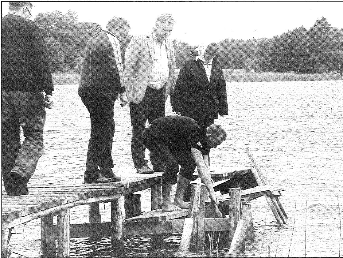
● Pagājušā gada vasarā Pelēču ezerā ielaistajiem 16 000 mazo zandartiņu tagad ir kompānija – vairāk kā 8000 lidaku mazuļu.

Zivis ezerā ielaista projekta "Zivju resursu pavairošana un atražošanas Pelēču ezerā II" ietvaros. Lidaku mazuļus piegādāja zivju audzētava "Rūja", kas dibināta 2005. gadā, pārņemot daļu infrastruktūras no bijušās zonālās zivju audzētavas "Rūja" teritorijas. Zivju audzētava apsaimnie-