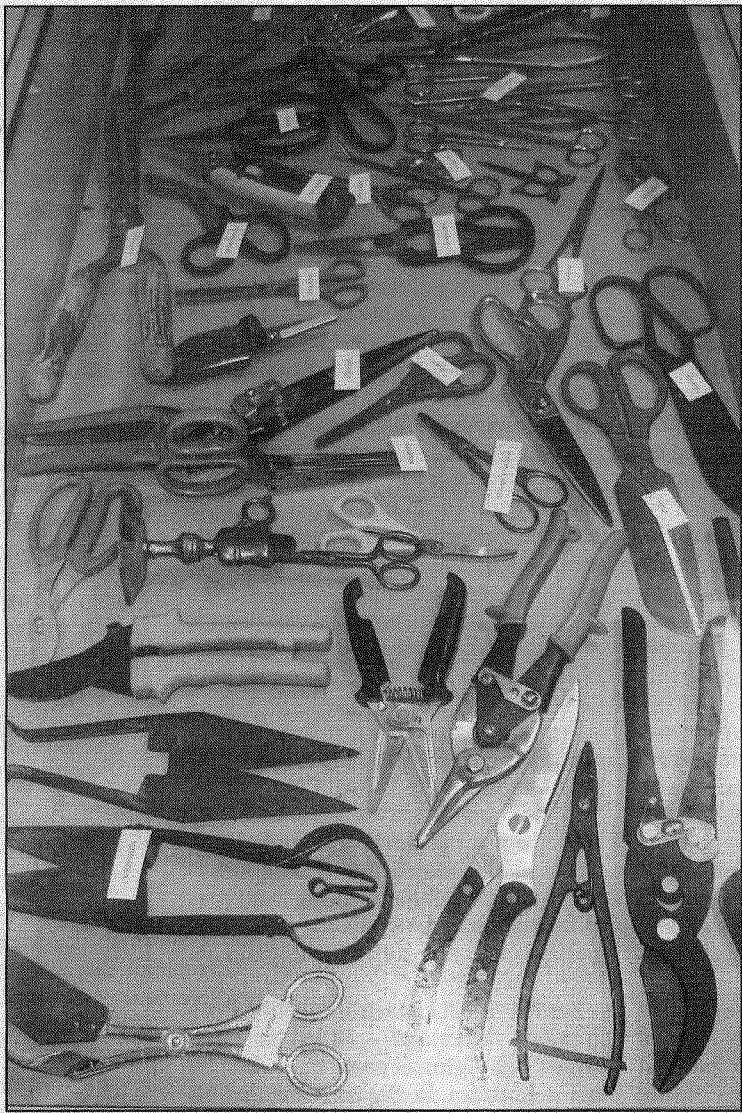
● Ieskatā šķēru kolekcijā.

Par daudzām grieznēm skatītāji teic, ka zina, kam tās domātas, taču par citām grūti