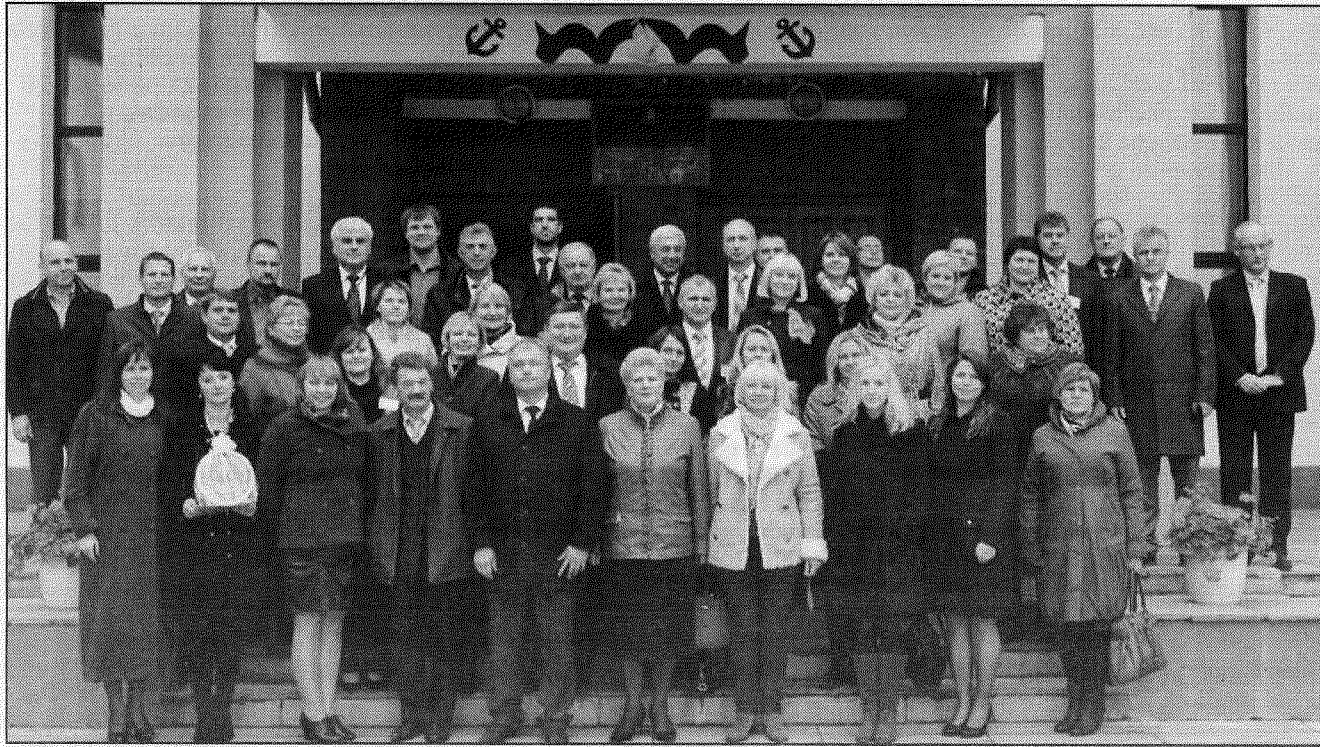
● Braslavā uz Eiroreģiona «Ezeru zeme» piecpadsmit gadu jubilejas sēdi bija pulcējušies iesaistīto pašvaldību vadītāji, tajā skaitā arī Eiroreģiona biedri no bijušā Preiļu rajona.

Senu draugu tikšanās, atskats uz kopīgi aizvadītiem 15 veiksmīgiem sadarbības un darba gadiem, daudziem šajā laikā īstenotiem Latvijas, Lietuvas, Krievijas un Baltkrievijas pašvaldību kopprojektiem. Tā raksturojama 11. oktobrī Baltkrievijas pilsētā Braslavā notikusi Eiroreģiona «Ezeru zeme» padomes 30. jubilejas sēde. Latviju Eiroreģionā pārstāv 30 pašvaldības.