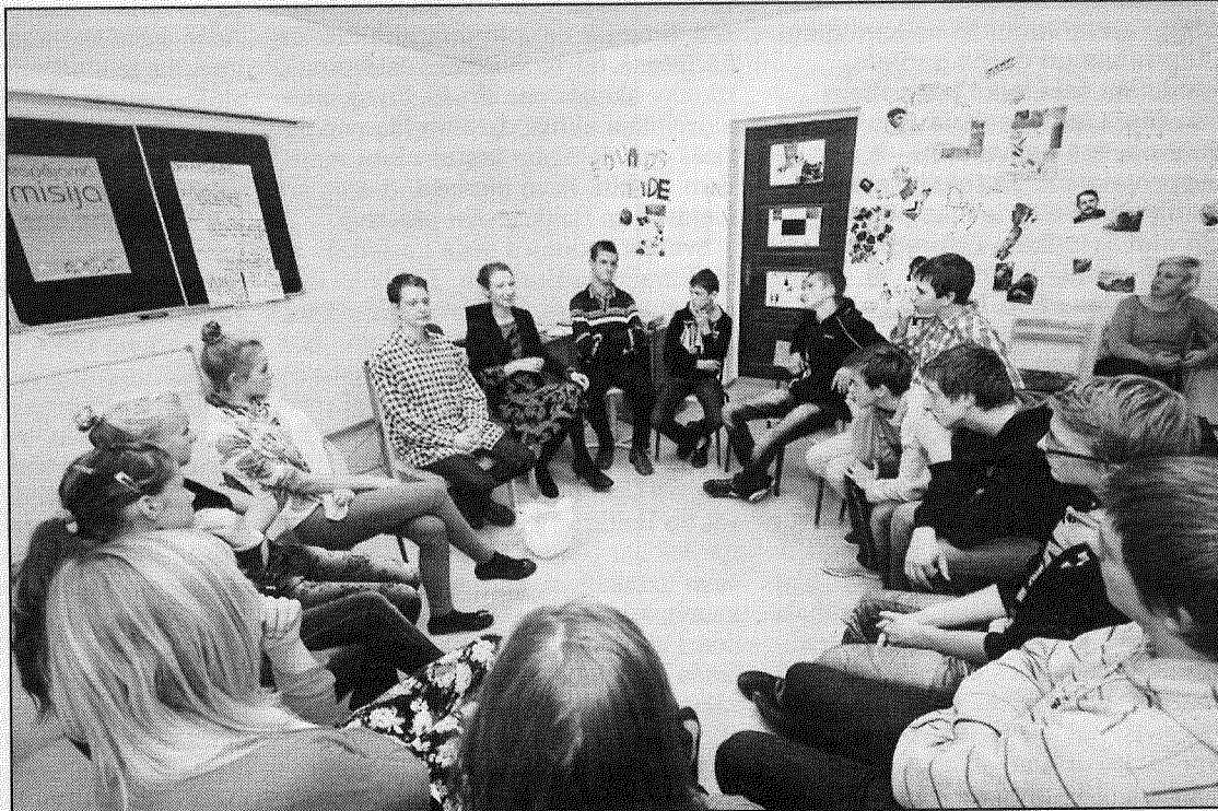
● Rožupes pamatskolas devītklasniekiem patika stunda repera vadībā.