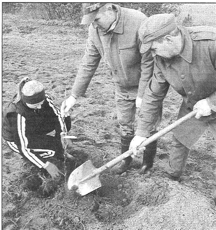
● Visi, kam vien bija spēks — gan sociālās aprūpes centra «Aglona» iemītnieki, gan darbinieki — piedalījās augļu dārza ierīkošanā. Tagad augļu kociņi un krūmogulāji būs jāsargā no zaķiem, bet pavasārī varēs priecāties par pirmajiem ziediem.

Sociālās aprūpes centra «Aglona» iemītnieku sirdis nu visu ziemu mājās priekā dzirksts un cerība uz pavasari, kad saplauks un uzdziedēs nule iestādītais augļu dārzs.