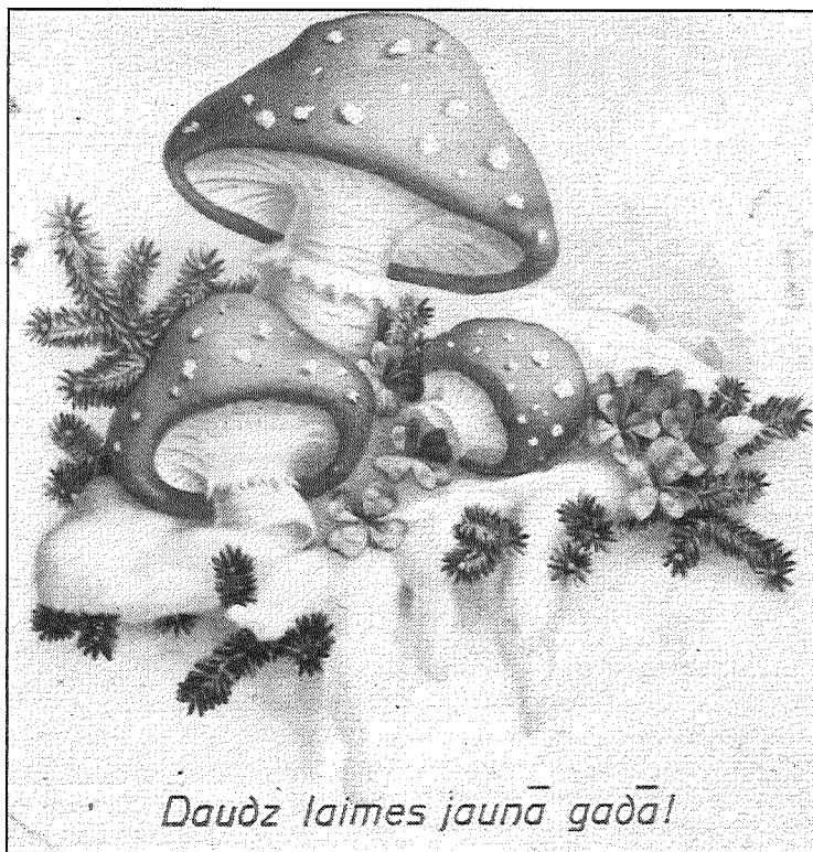
● Mušmires uz apsnigušiem egļu zariem? Izrādās, tās ir pārticības un laimes nesējas.

Mēģinot izlasīt dažādos rok-rakstos tekstu Ziemassvētku apsveikumos, kuri atrodami Preiļu vēstures un lietišķās mākslas muzeja kolekcijā, jaunie pētnieki konstatēja, ka arī 20. un 30. gados rakstītāji bijuši pietiekami "slinki", jo visbiežāk sastopami isi novēlējumi: "No sirds novēlam priecīgus svētkus!", "Daudz naudas un veselības!", "Priecīgus Ziemassvētkus un visu labiņu!", "Priekus bez sava gala visus Ziemassvētkus!", "Jautrus svētkus un skaistu eglīti vēlam mazajiem un tāpat jums visiem!", "Prieci-