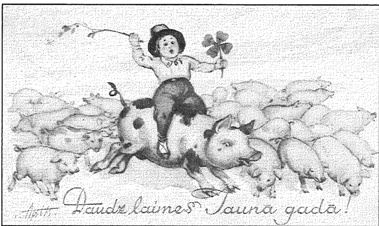
● Smaidīga bērna sejiņa, āboliņa četrlapītis un cūku bariņš – no vāciešiem pārņemtais stils.

Simbolu valoda un mītiska domāšana pirms pāris gadsimtiem bija mūsu senču ikdiena. Viņi vairāk saprata un pielietoja simbolus, kurus paši bija radījuši, izskaidrojot un novērojot dabas parādības, notiekošo visapkārt un vizuāli iemiesojot jēdzienu priekšmetā. Kā neapstrīdams fakts tas apstiprinās laikmeta liecībās – apsveikuma pastkartēs, kurās tiek izmantoti visdažādākie simboli labklājības, veiksmes, prieka un laimes piesaistīšanai.