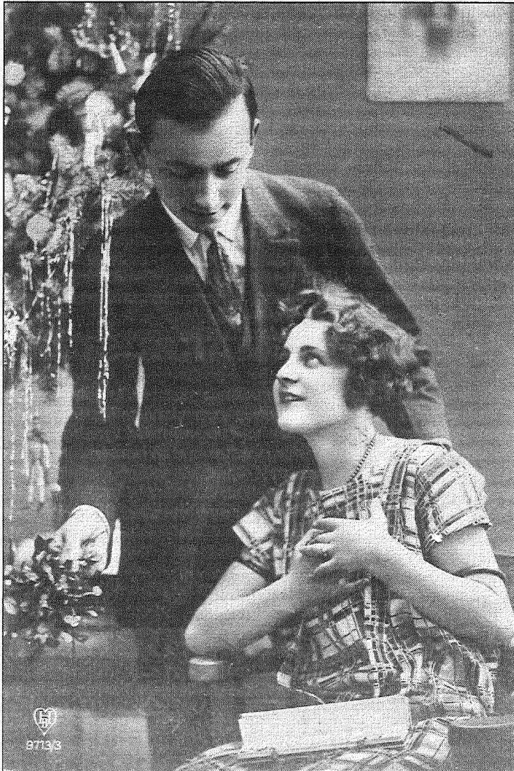
● Francijas ietekme pastkartēs – modes dāmas, glauni kungi, ziedi, egļu zari un dāvanu iesaiņojumi.

gi un omulīgus svētkus vēlējam!". Visticamāk, ka isajiem novēlējumu tekstiem izskaidrojums ir jaunas attieksmes veidošanās pret sūtāmās informācijas privātumu, jo atklātnes tekstu bija iespējams izlasīt ikvienam, kura rokās tas nonāca. Tradicionāli sarakstei bija intīms un ļoti personisks raksturs, ko nodrošināja vēstules sūtīšana rullī vai ievietošana aploksnē. Jāatzīmē, ka, neskatoties uz visu, tika izmantota arī dzeja un intīmas rindas, kas atrodamas muzeja kolekcijā esošajās kartiņās.