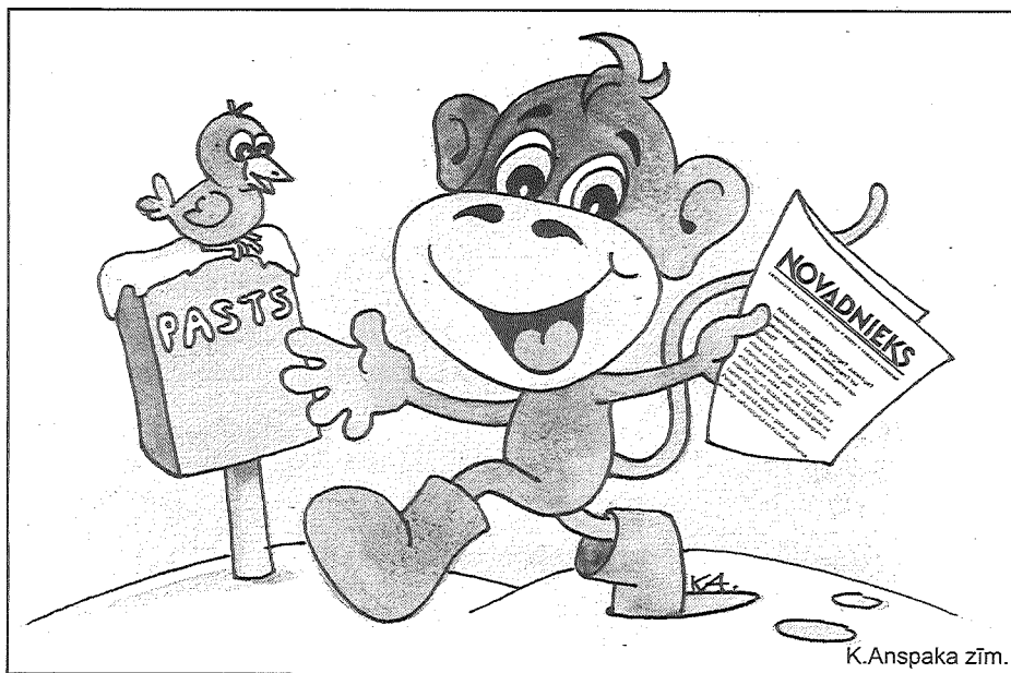
K. Anspaka zīm.

VĒRSIS (1925., 1937., 1949., 1961., 1973., 1985., 1997., 2009., 2021.). Šis gads Vērsim nav pārāk piemērots. Mūžīgā nestabilitāte un pārsteigumi neļauj viņam plānot savu darbību, viņa plāni nepārtraukti tiek izjaukti. Rezultātā iespējamās lielākas vai mazākas nepatikšanas, bet mūžīgi uztraukumi var izraisīt pat veselības traucējumus. Pareizi darīs tie Vērsi, kuri, cik iespējams, pacentīsies nesatraukties par lietām, kas tieši viņus neskar, un nodarbošies ar to, kur iznākums galvenokārt atkarīgs tikai no paša. Tiesa, no visām nepatikšanām tādējādi izvairīties neizdosies, un tad Vērsim vajadzēs likt lietā savu neatlaidību un spēju rast izeju pat visai grūtā situācijā. Gudri darīs tie Vērsi, kuri visās lietās nepaļausies tikai uz laimīgu gadījumu, bet arī savu spēku un izturību. Svarīgi arī izvēlēties istās prioritātes – Pērtiķa radītajā jucekliģi visu paspēt nemaz nebūs iespējams. Personīgajā dzīvē vientuļajiem Vērsiem gads sola patīkamas pārmaiņas.