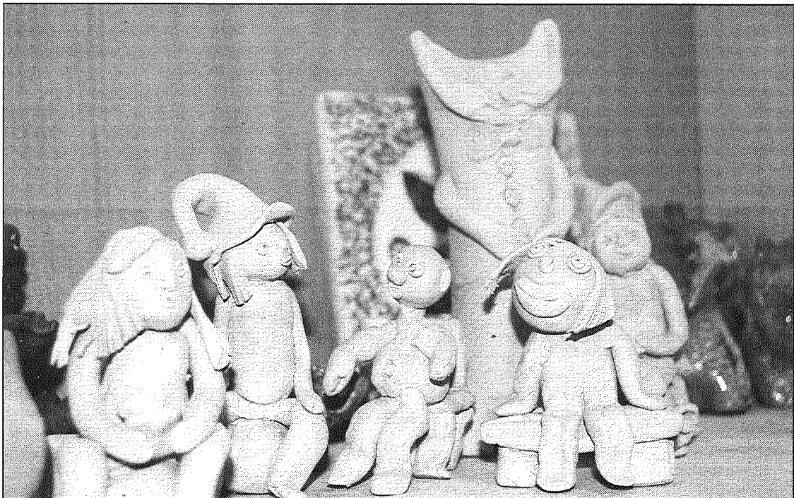
● Keramikas pulciņa audzēkņu darbi, kas gaida apdedzināšanu.

Latvijas māls, bet saviem personīgajiem izstrādājumiem māksliniece iepērk Spānijas balto mālu, savukārt porcelāns tiek vests gan no Anglijas, gan no Portugāles.