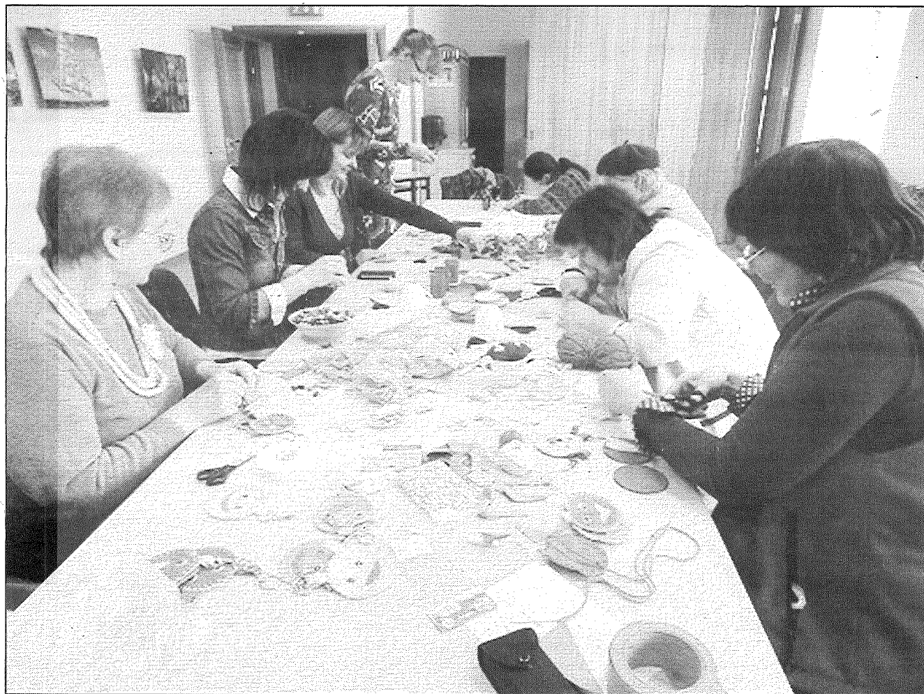
● Biedrībā "Baltā māja" top dāvanīgas bērniem.

Līvānu biedrībā "Baltā māja" turpinās projekts "Aktīvi — radoši — zinoši", ko atbalstīja nodibinājums "Latvijas Kopienas iniciatīvu fonds". Projekts tiek realizēts ar mērķi sekmēt Līvānu novada kopienas saliedētību un dzīves kvalitātes uzlabošanu, īstenojot izglītojošas un radošas iniciatīvas.